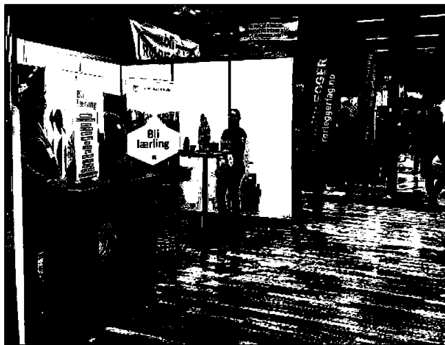
Utdanningsmesse i Trondheim i februar