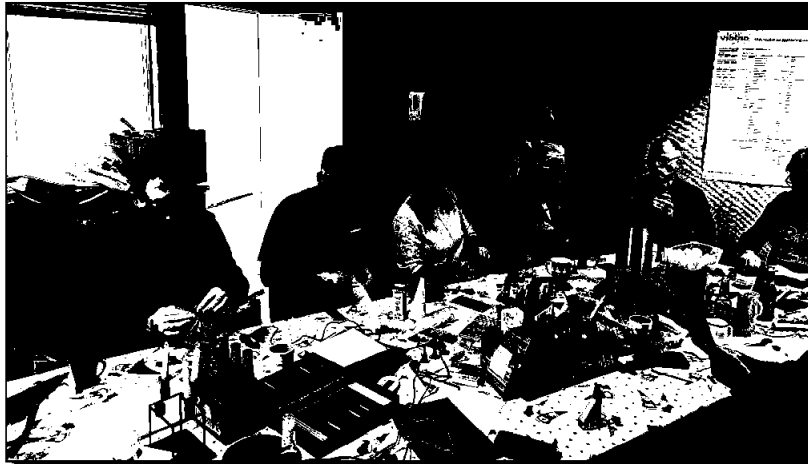
Juleverksted med opplæringskontorene i Innherred