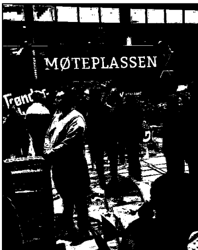
Utdanningsmesse på Verdal i November