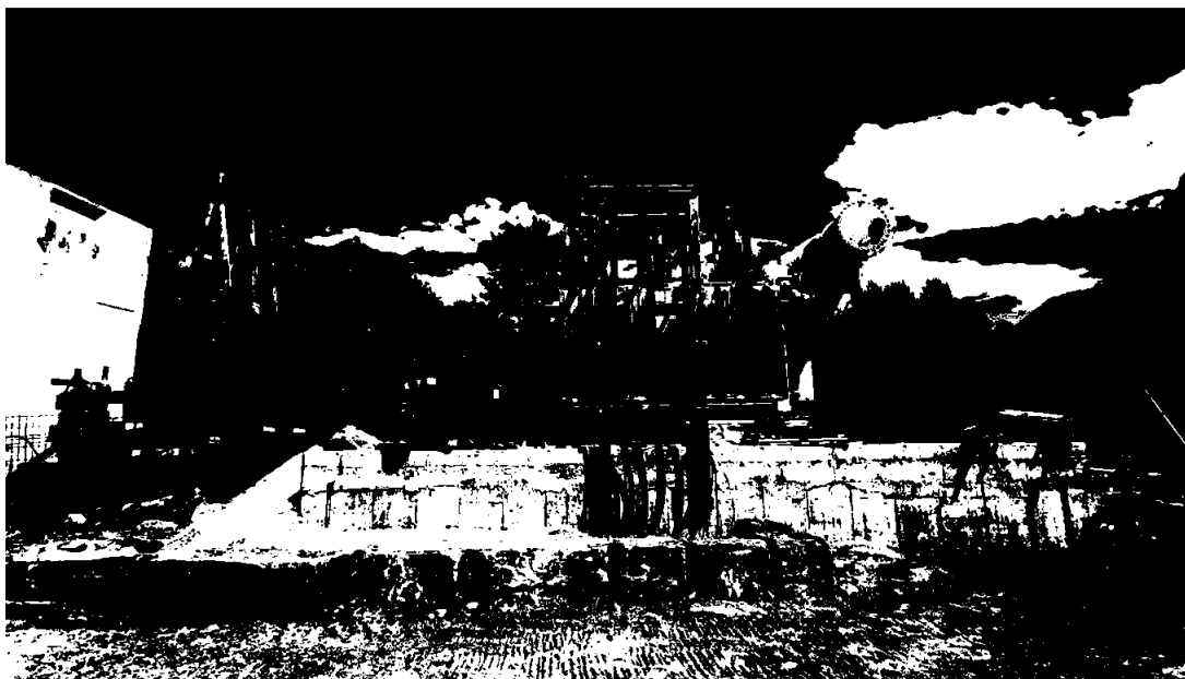
Ny transformatorstasjon på Bu i Ullensvang. Eit av fleire investeringsprosjekt for elektrifisering av fergesamband i regionen.

Nedanfor er statistikk for antall kundar og forbruk pr kunde fordelt etter dei gamle kommunegrensene: