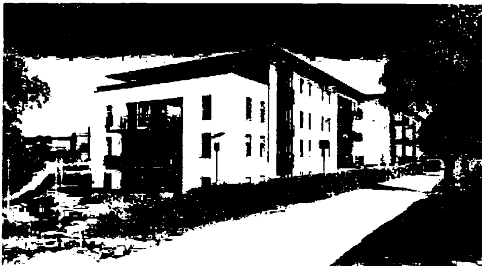
SAMEIET ØSTERVEIEN 45