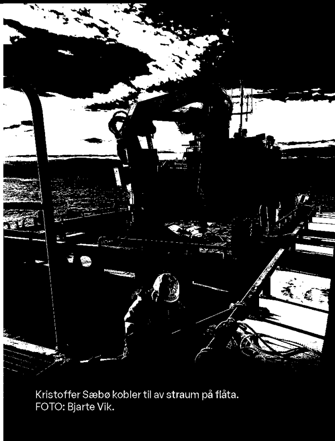
Kristoffer Sæbø kobler til av stram på flåta.