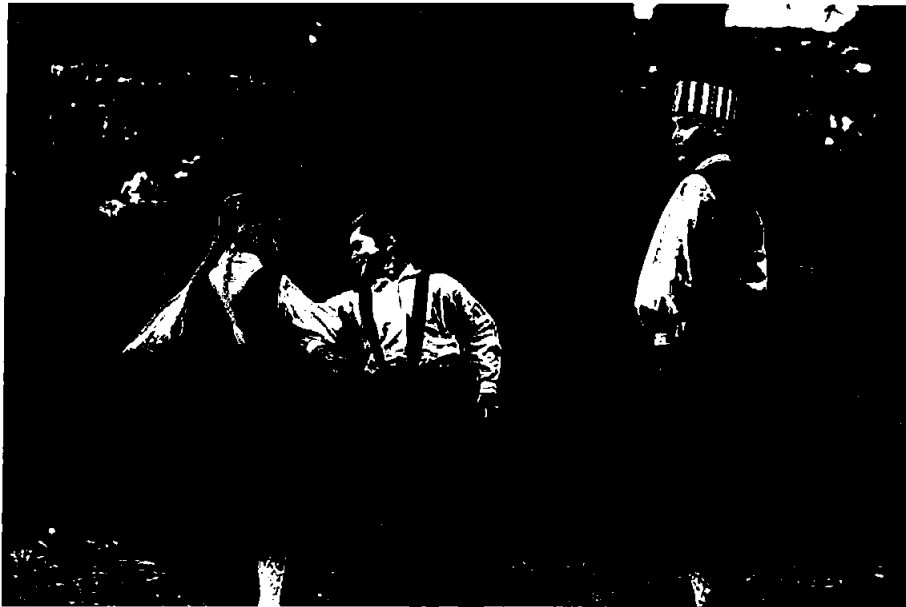
Fra Dansens Dag: Perkonkals/Latvisk kulturskole . Foto Øyvind Johannessen

Vi gjennomførte i år en koronaversjon av vårt vanlige arrangement: digital streamet dans og i tillegg en mini-dansefestival i samarbeid med Cinemateket Bergen.