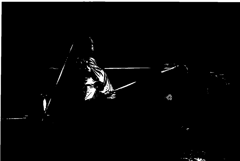
ESC ungdomskompani for samtidsdans. Fra premiere på Osafestivalen på Voss.

Forestillingen hadde premiere under Osafestivalen på Voss 30. oktober og ble så vist med to forestillinger i BITs program i desember. ESC ble også invitert til å vise et utdrag under utdelingen av Rafto-prisen på DNS. Forestillingen skal videre vises i Sandane i januar og på Færøyene i februar 2022.