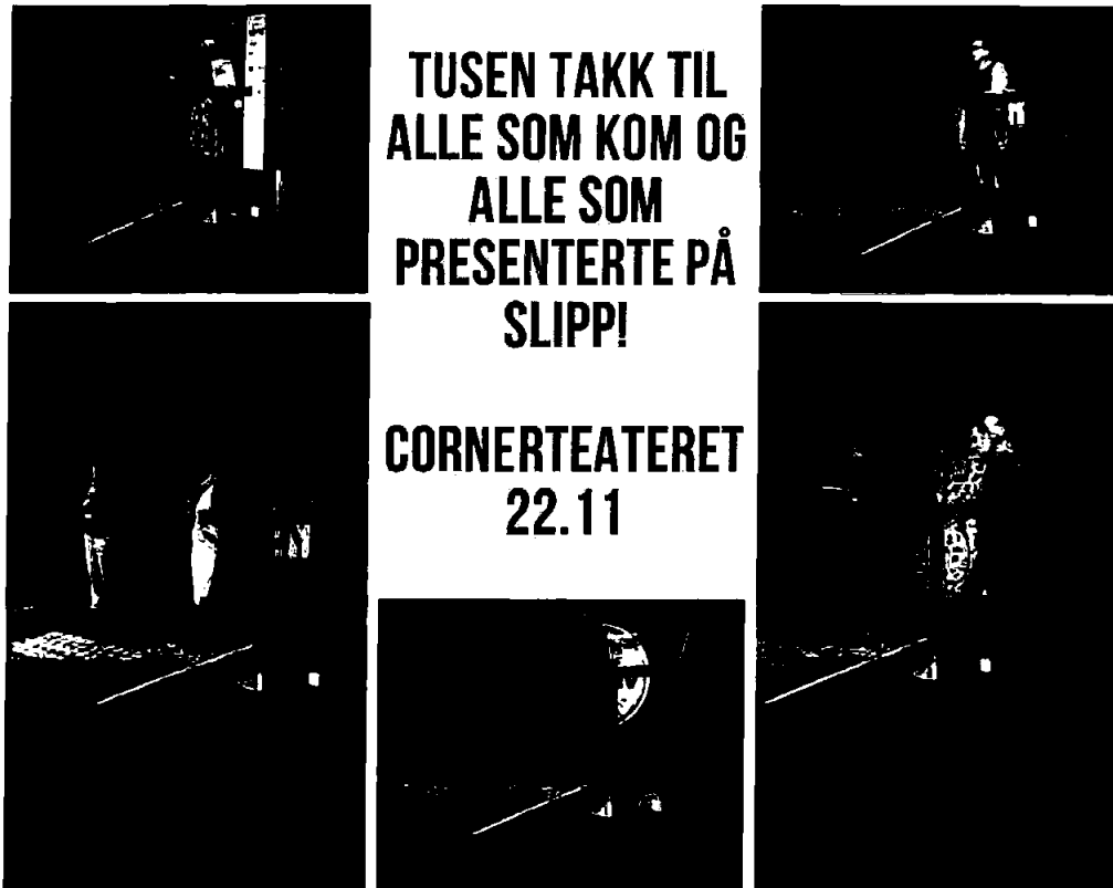
SLIPP bransjetreff på Comerteateret.