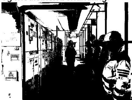
Gjennomgang av styringssystemer.

For driftsåret 2023 hadde selskapet 4 mindre personskader med fravær og medisinsk behandling.