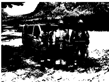
Arbeidslag i aksjon.

Styret og adm.dir. bekrefter at forutsetningen for fortsatt drift er til stede ved avleggelse av årsregnskapet.