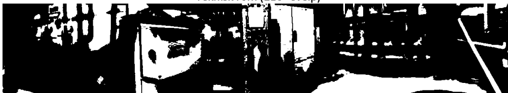
Teknisk rom (210° sveip)

Sprinklerventiler varmepumpe El tavle Varmefordeling husene varmtvann