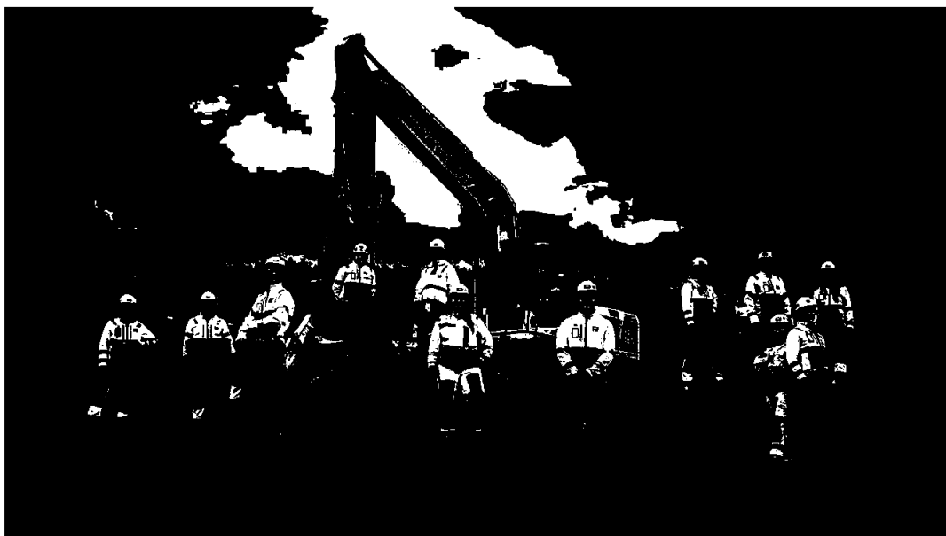
AF Gruppen/Erik Krafft