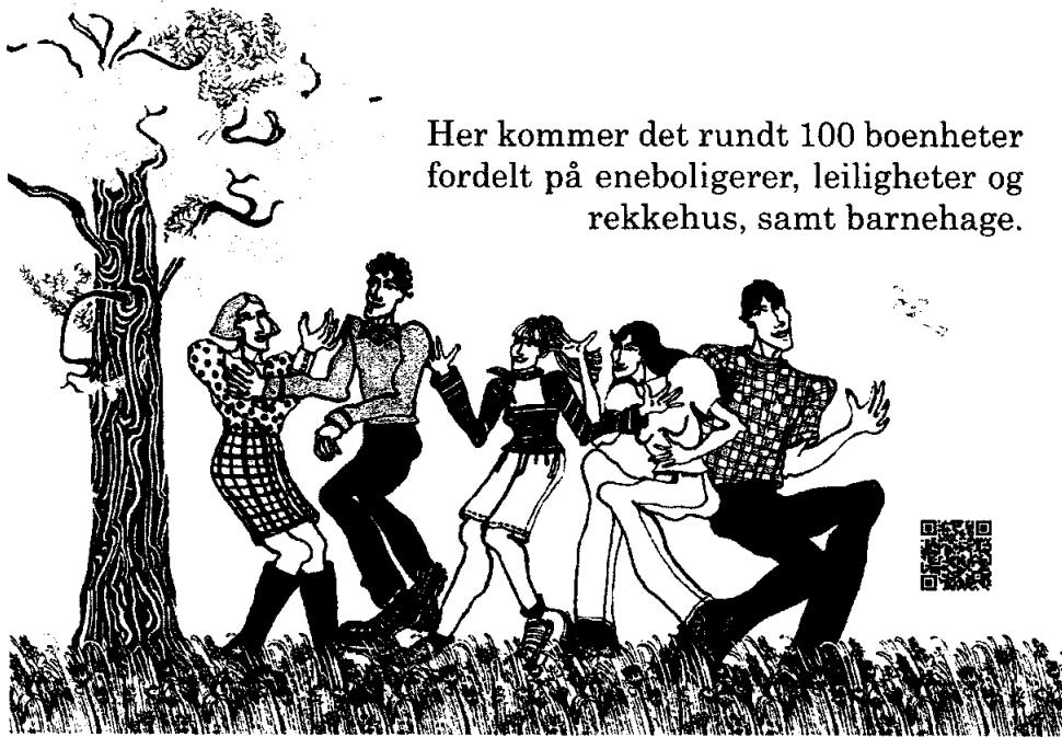
«Tanbergdansen» - Fase 1 i utbyggingen av reguleringsområde Tanberghøgda