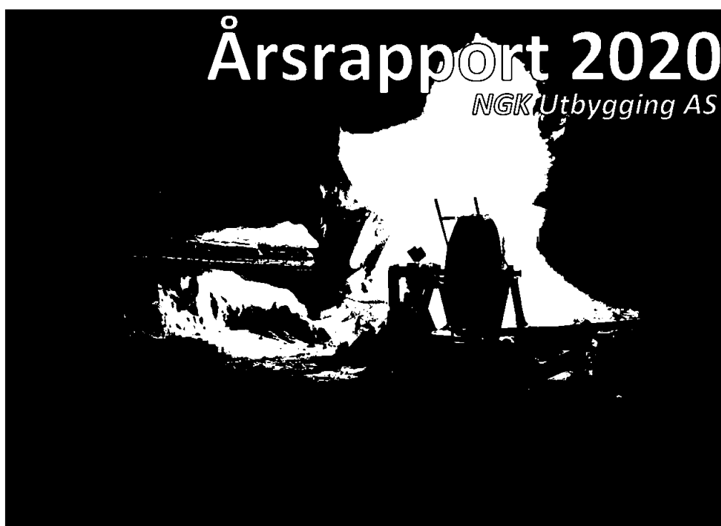
Driving av verdens nordligste TBM-tunnel på Salvasskardelva, Bardu kommune, januar 2020