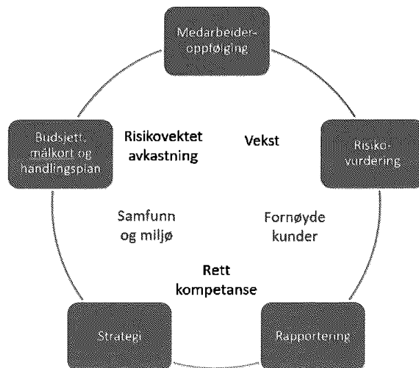
figur: Virksomhetsstyringen i Fredrikstad Energi

Arbeidet med å vurdere og håndtere risiko er en integrert del av virksomhetsstyringen og nedenfor er alle elementene i virksomhetsstyringen som også inngår i konsernets årshjul.