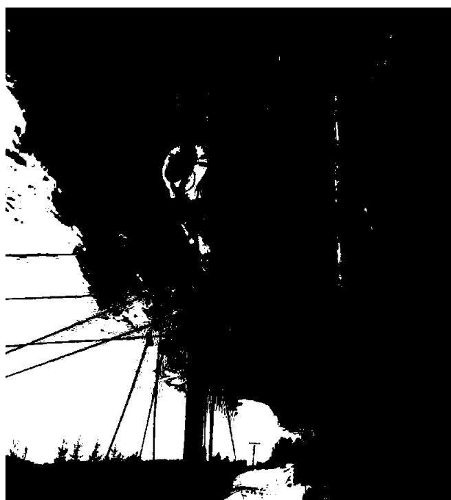
Arbeid med fiber Flatvoll – Tangen.