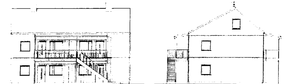
Fasade 3 Nord-Øst