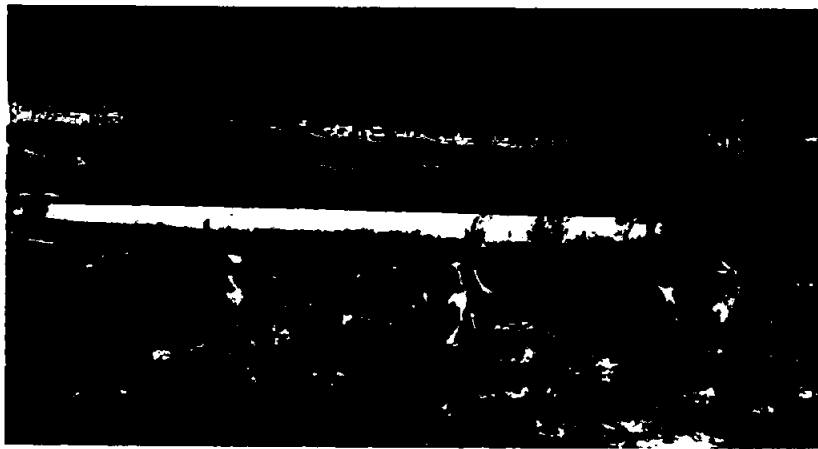
Alltid trivelig å se dyr som er på beite.