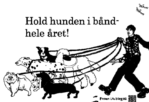
«Hold hunden i bånd!» Ill: Marte F. Skarstein

Ca 90 % av Tanberghøgda er kjøpt og eies av selskapet. Balanseført verdi av tomta var 71 857 000 kroner ved årsskiftet.