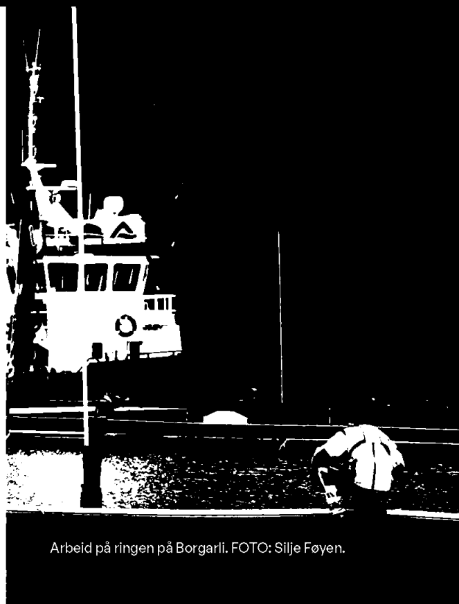
Arbeid på ringen på Borgarli.