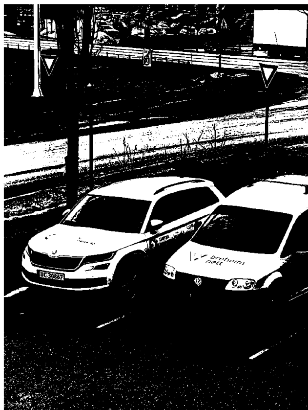
Omprofilering til Breheim Nett