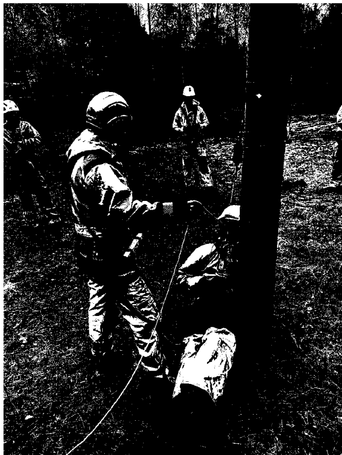
Nedfiringkurs for våre tilsette