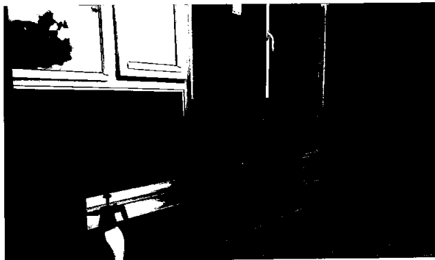
Demo: Utedel montert tett på trevegg mellom terassedør og glass.