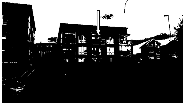
Ingen synlig utedel fra utsiden.