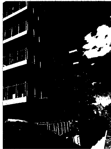
Brattlitoppen boligprosjekt, Oslo