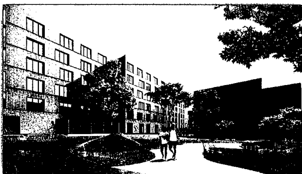
Kringsjå Studentby, byggetrinn 3.

Selskapet har for tiden ingen pågående forsknings- eller utviklingsaktiviteter.