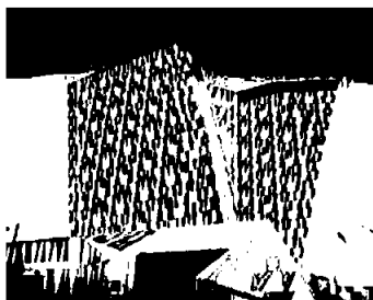
AC Hotel Bella Sky Copenhagen

Wenaasgruppen har til sammen fem hoteller i Tyskland i tillegg til et større Wellness Center i Berlin. Tre av hotellene drives av Radisson Hotel Group og to av hotellene er leid ut til Scandic Hotels. Konsernets hoteller hadde i snitt et belegg på 22,7 %, gjennomsnittspriser på EUR 110 og RevPAR på EUR 25. Renoveringen av Radisson Blu Hotel Hamburg ble ferdigstilt