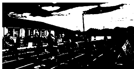
Idrettsanlegget i Måndalen