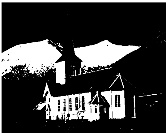
Voll kirke, Måndalen