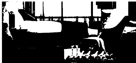
Radisson Blu Hotel Moscow Sheremetyevo Airport

Samlet avkastning på aksje- og obligasjonsporteføljen ble -2,2 % (kr -57 millioner). I ettertid kan man si at man ikke burde solgt aksjer og obligasjoner i mars/april, men med den store usikkerheten i markedet og de forpliktelsene man har ved å eie og drive hoteller var det nødvendig å sikre en økt kontantbeholdning. Totalt sett har konsernet redusert porteføljen med over kr 1 000 millioner i løpet av året, mens bankinnskudd har økt med over kr 500 millioner. Gjennomsnittlig årlig avkastning for konsernet over de siste tre år er 6,5 % og over de siste fem år 8,6 %.