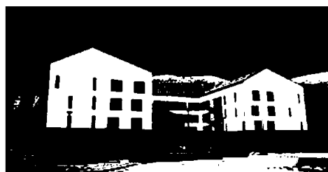
Rauma Helsehus, Åndalsnes