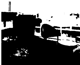
Scandic Berlin Kurfürstendamm