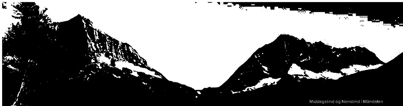
Middagstind og Nonstind i Måndalen

turruten Romsdalseggen, med over 50 000 besøkende i året.