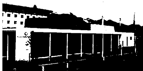
Rauma Kulturhus, Åndalsnes

Etter initiativ fra lokale krefter i Måndalen har man sammen med kommunen kommet frem til en god løsning for en ny og moderne barne- og ungdomsskole i bygda. Wenaasgruppen har involvert seg og bidrar med inntil kr 20 millioner i prosjektet. Byggingen startet i slutten av 2020 og skolen skal stå ferdig i 2022.