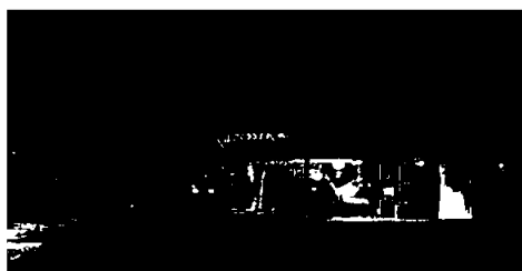
Radisson Blu Resort & Spa Gran Canaria Mogan