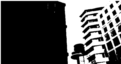
Comfort Hotel Arlanda Airport Terminal

Det vil ta noe tid før hotellbransjen er tilbake for fullt, men alle prognoser tilsier at reiseaktiviteten vil ta seg raskt opp når mange er vaksinert og restriksjonene letter. Det er ikke mangel på etterspørsel som er problemet, det er restriksjonene som gjør at hotellene står tomme. Dette så man tydelig på den raske økningen i reiseaktivitet sommeren 2020.