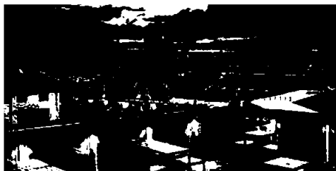
Utsikt fra takterrassen på Radisson Blu Hotel Prague