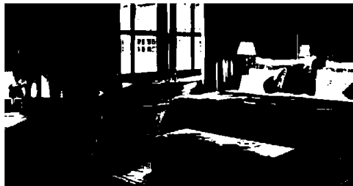
Clarion Hotel & Congress Oslo Airport