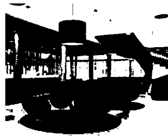
Radisson Blu Hotel Hamburg