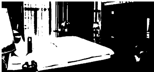
Radisson Royal Hotel St Petersburg

De ti hotellene med til sammen 4 078 rom fremstår som internasjonale hoteller med høy standard og internasjonal «branding». De russiske hotellselskapene har ingen ekstern bankgjeld eller gjeld til morselskapet.