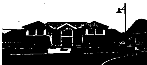
Wenaasgruppens hovedkontor i Måndalen

De siste årene har konsernet solgt selskaper og aktiviteter som er utenfor hovedstrategien. Dette har vært en vellykket prosess, og man er tilnærmet ferdig med omstruktureringen. Hotellporteføljen består nå hovedsakelig av store sentrumsnære hoteller i større byer i Europa. Det siste tilskuddet i porteføljen Comfort Hotel Arlanda Airport Terminal åpnet i januar 2020 med 503 rom. Wenaasgruppen eier 60 % av hotellet som ligger på terminalen på Arlanda Airport i Stockholm.