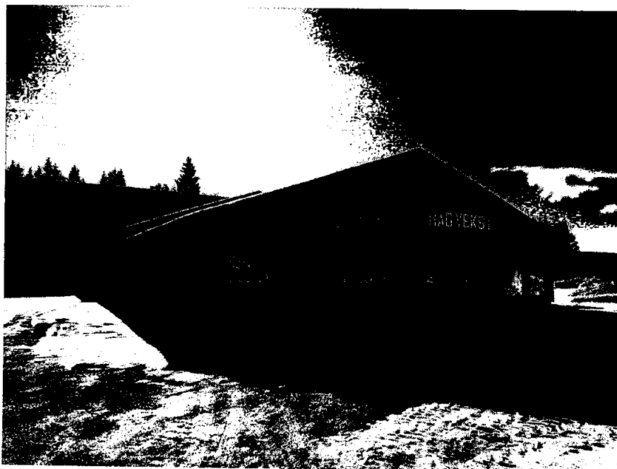
Nybygg Trofors, ferdigstilt og overtatt desember 2021, lagerbygg i bakgrunn

Ved avdeling Hattfjelldal leier virksomheten lokaler av Hattfjelldal service- og næringsbygg, lokalisert Bensinstasjonsveien 1, 8690 Hattfjelldal.