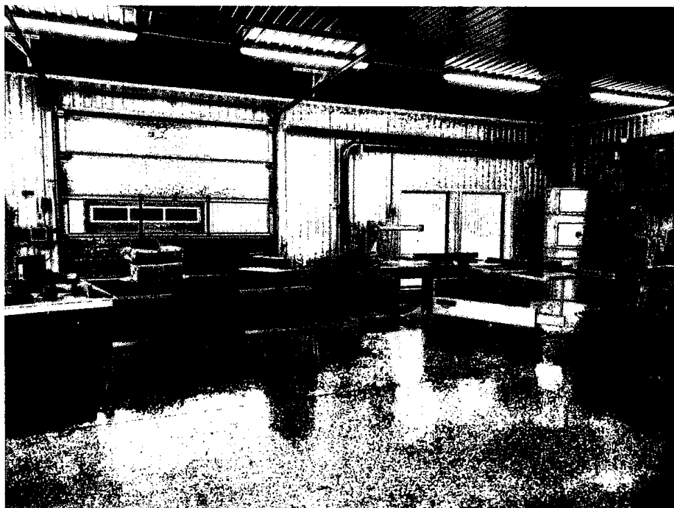
Snekkerverksted i nye lokaler Trofors

Bedriften har i løpet av 2021 produsert og solgt diverse møbler, innredninger, trapp, vindusomramminger, sprosserammer, etc. dette til både til privatpersoner og bedrifter. Det ble i desember 2021 tatt i bruk areal til snekkerverksted i nytt bygg på Trofors.