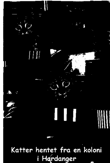
Katter hentet fra en koloni i Hårdanger

Oliver, Ariel og Jasmin sin historie endte godt tross alt, de får vokse opp og vil få gode liv hos dedikerte ny eiere.