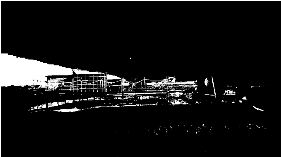
Kapasitetsprosjekt KSAT - LNS Spitsbergen

Penneo document key: Z0XWJ-605GW-SWLOU-0CKV-G-PGAZL-ASTJT