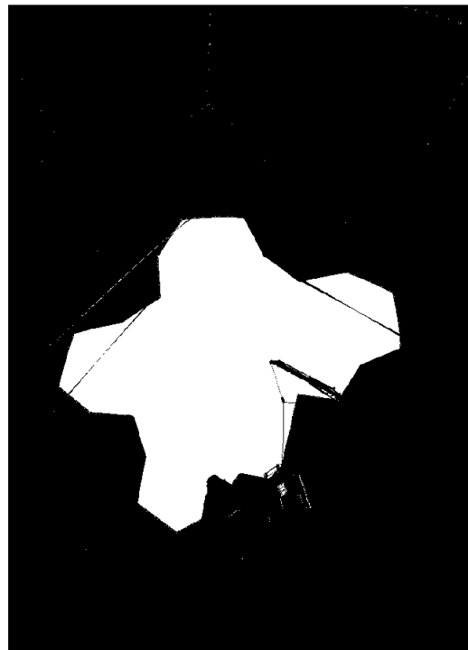
Bygging av radom, LNS Spitsbergen

Styret presiserer at det er betydelig usikkerhet knyttet til vurderinger av fremtidige forhold.