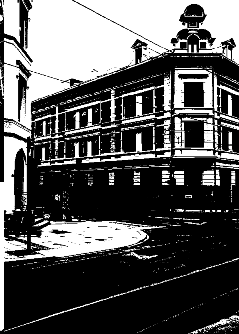
Pressens hus.