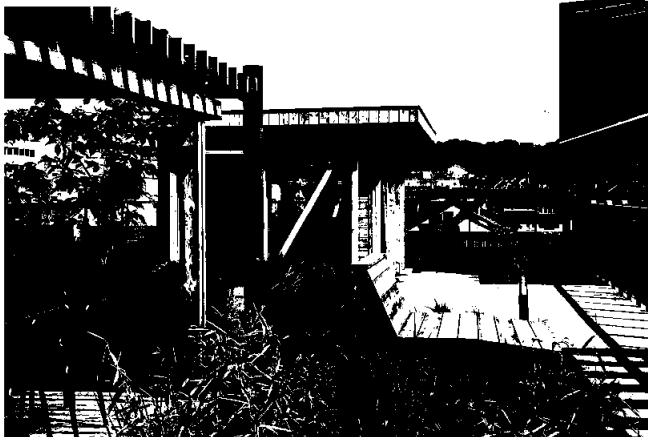
Nordre gate.