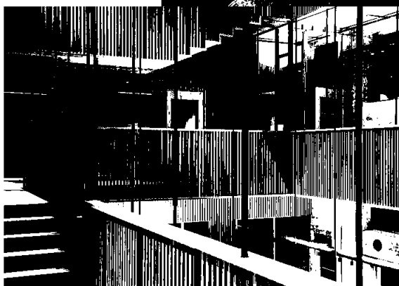
Pressens hus.