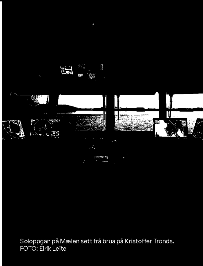
Soloppgan på Mælen sett frå brua på Kristoffer Tronds.