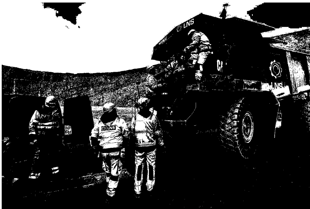
Beredskapsøvelse under HMS-uka ved LNS AS sitt anlegg i Tana

LNSE AS har ingen ansatte. Av styrets 6 medlemmer er det en kvinne. Konsernet har som policy at det ikke skal forekomme forskjellsbehandling grunnet kjønn, etnisitet, religion, alder eller på annen måte.