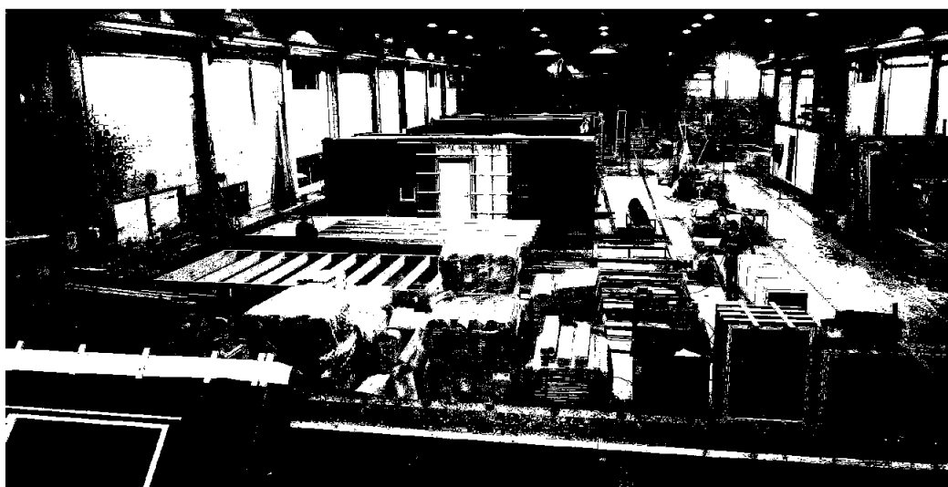
Produksjonshallen til Hålogaland element