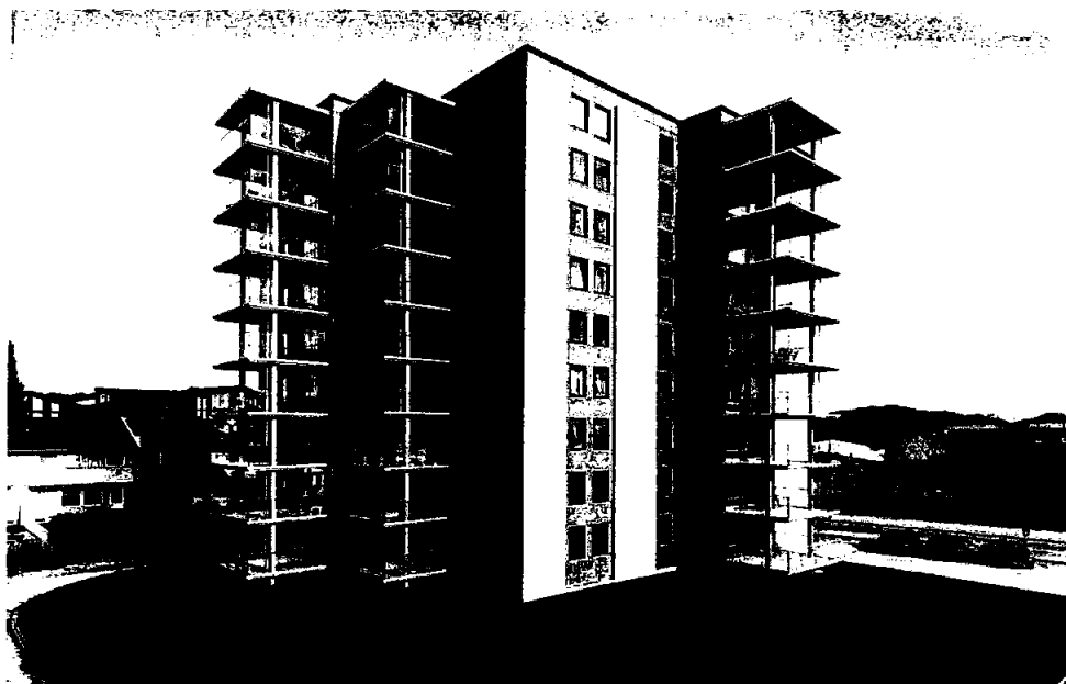
BORETTSLAGET ST. OLAVSVEI 33