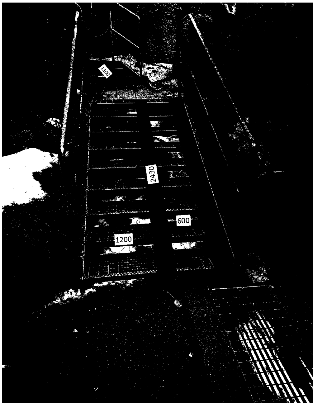
2 Ramper skissert i øvre del