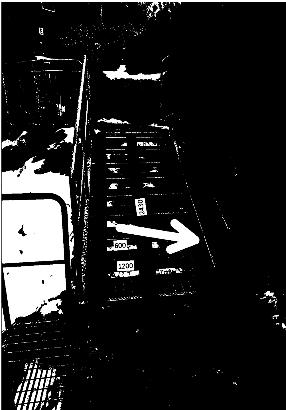
3 Ramper i nedre del. Rampene i skissen er speilvendt. Rampene foreslås montert på høyre side. Noe av mur flyttes.