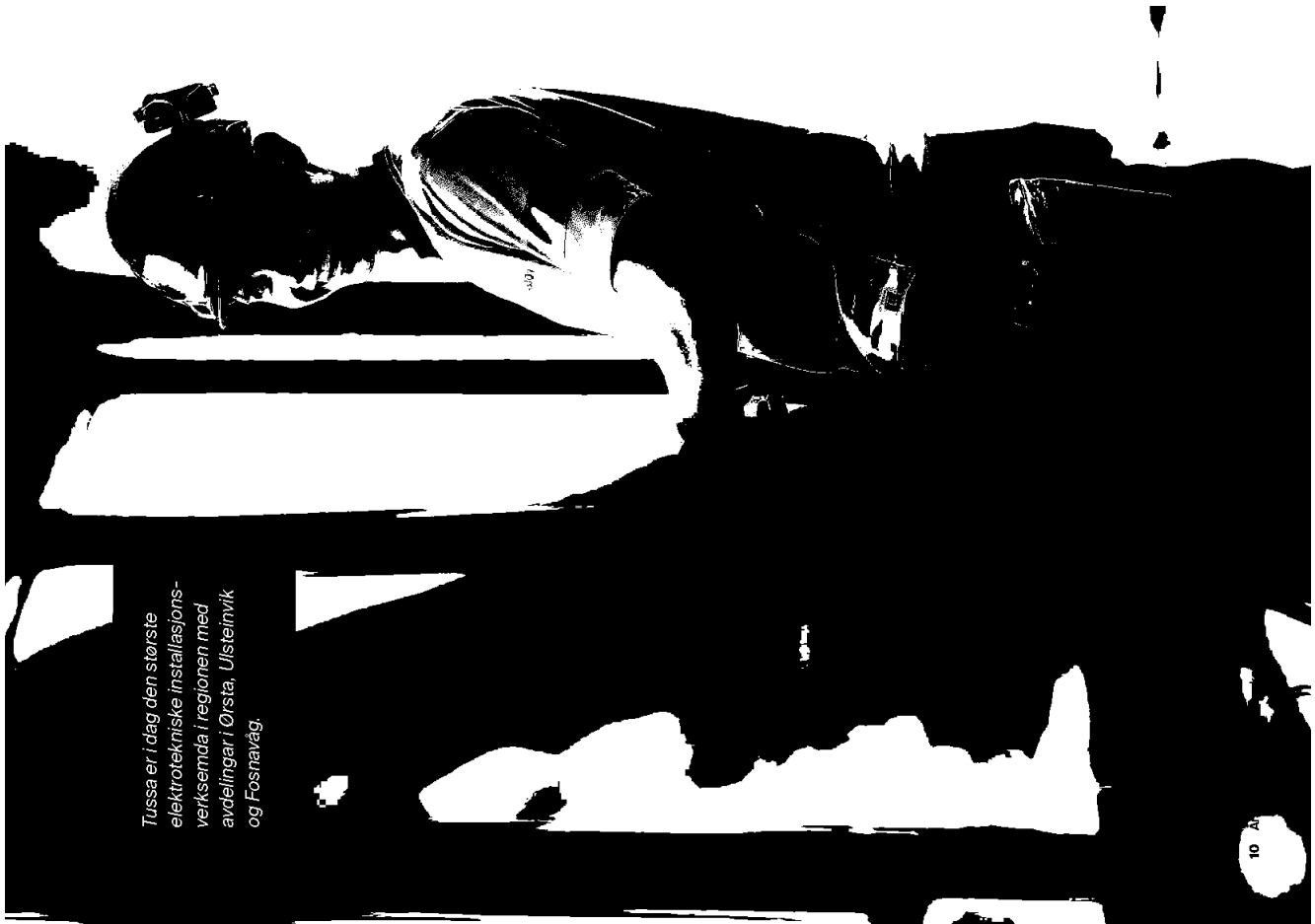
Tussa er i dag den største elektrotekniske installasjonsverksemda i regionen med avdelingar i Ørsta, Ulsteinvik og Fosnavåg.