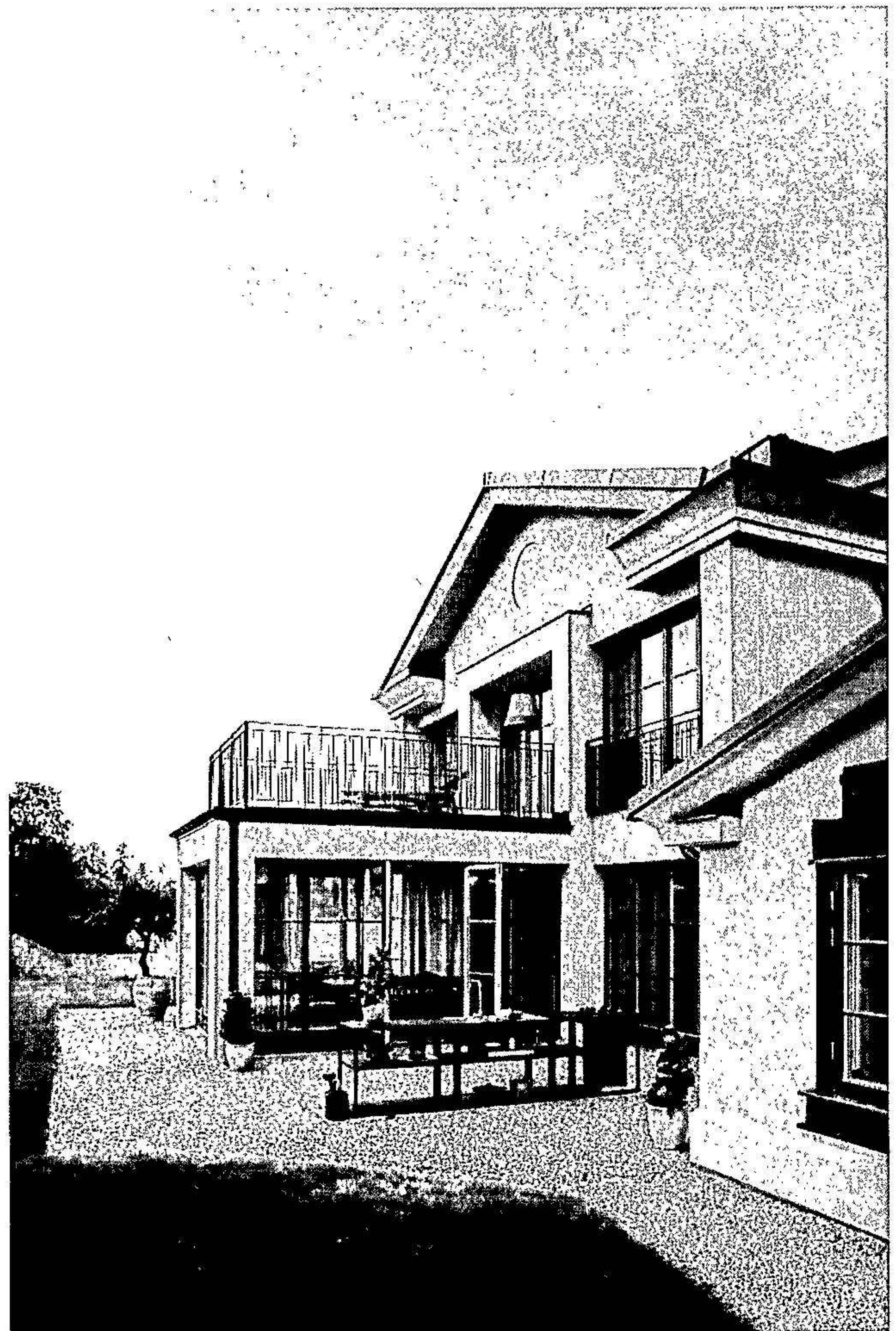
Nybyggd villa i Sigtuna

Arkitekt, VD, Fredrik Widigs 08-660 77 90