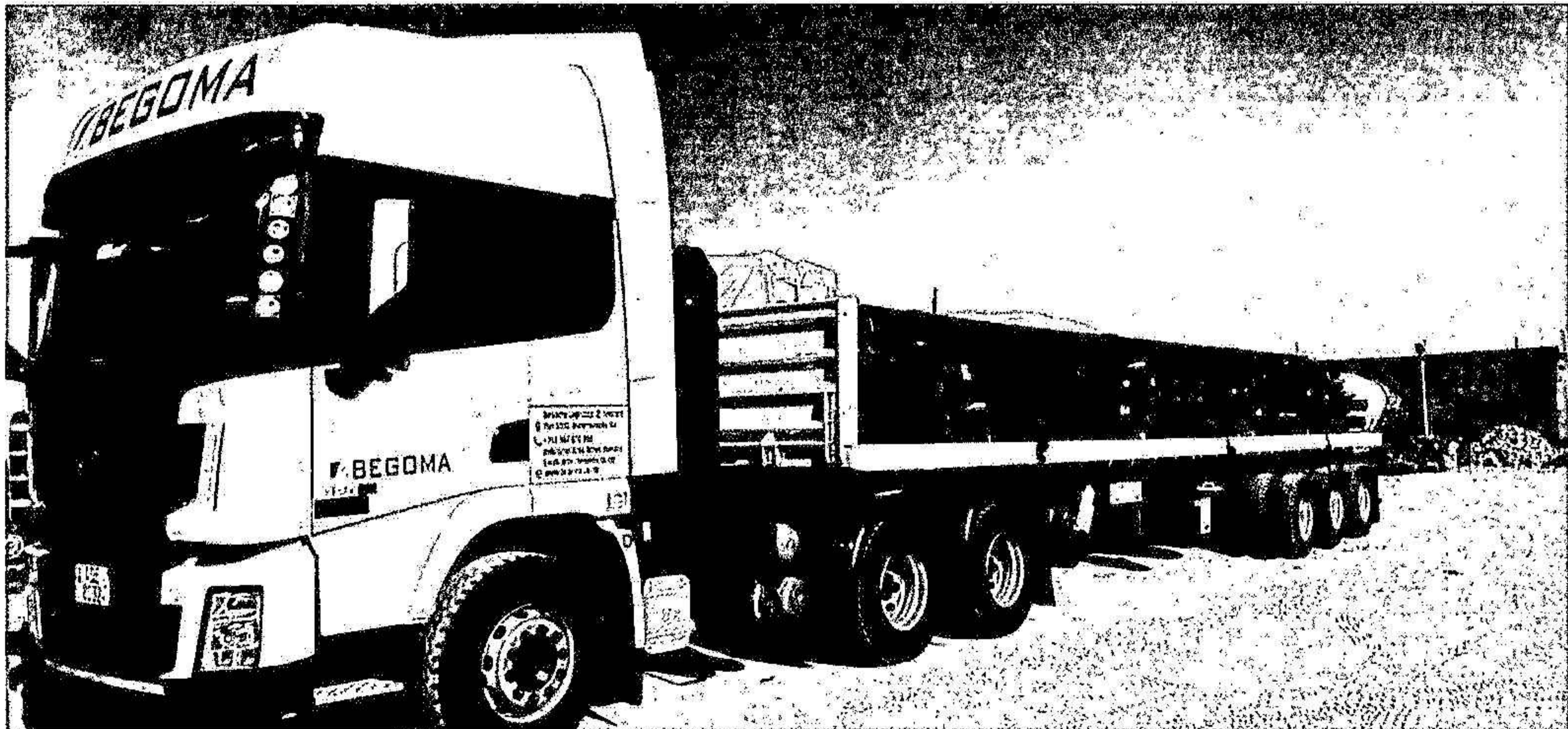
Under verksamhetsåret har ett systerbolag bildats i Zambia i södra Afrika.