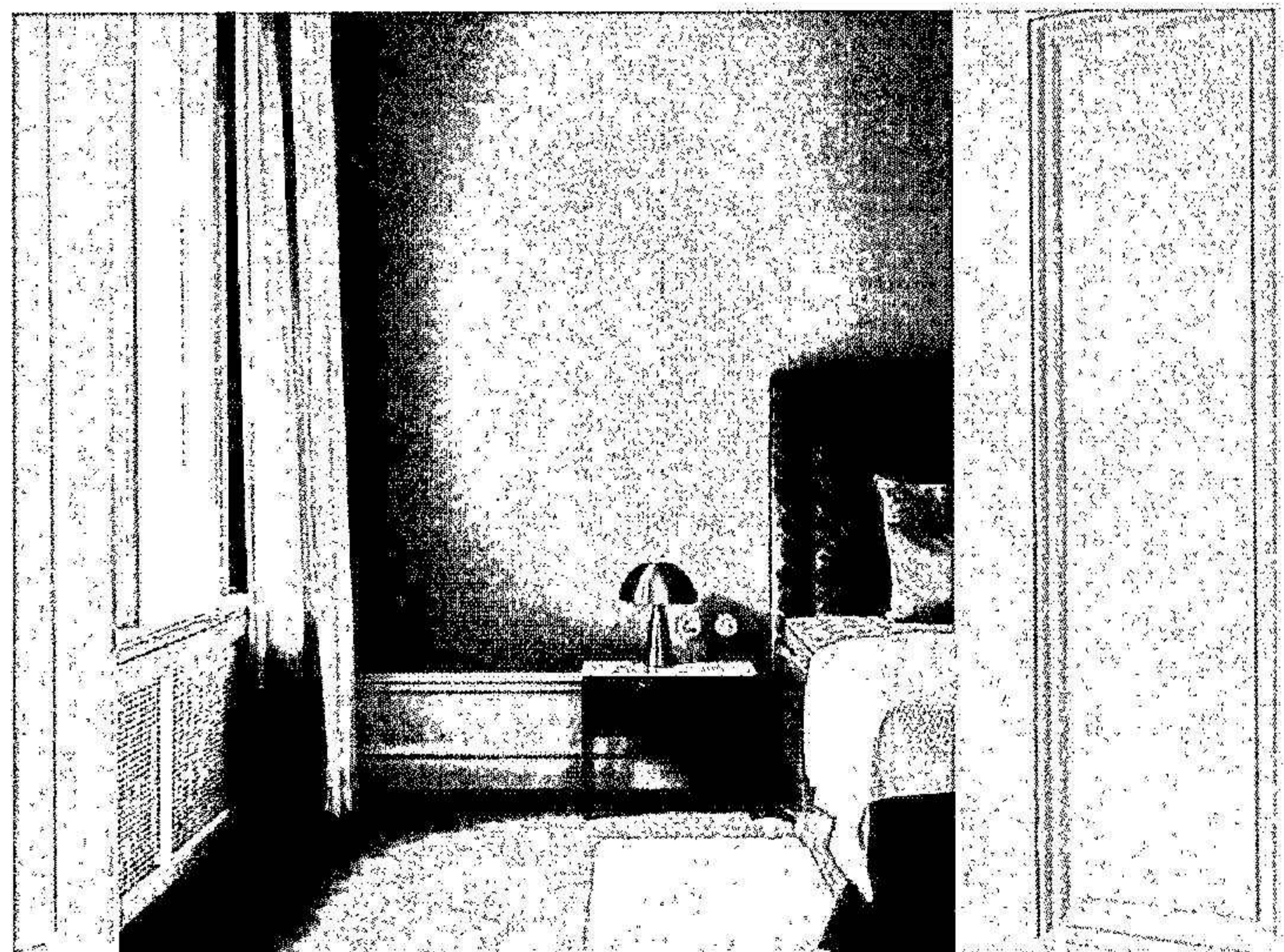
Sovrum från färdigställt projekt 2022.

Företaget har inga skulder utöver kortfristiga skulder som utgörs av moms och skatteskulder som inte justeras förrän vid den slutgiltiga skatteuträkningen 4 under 2023.