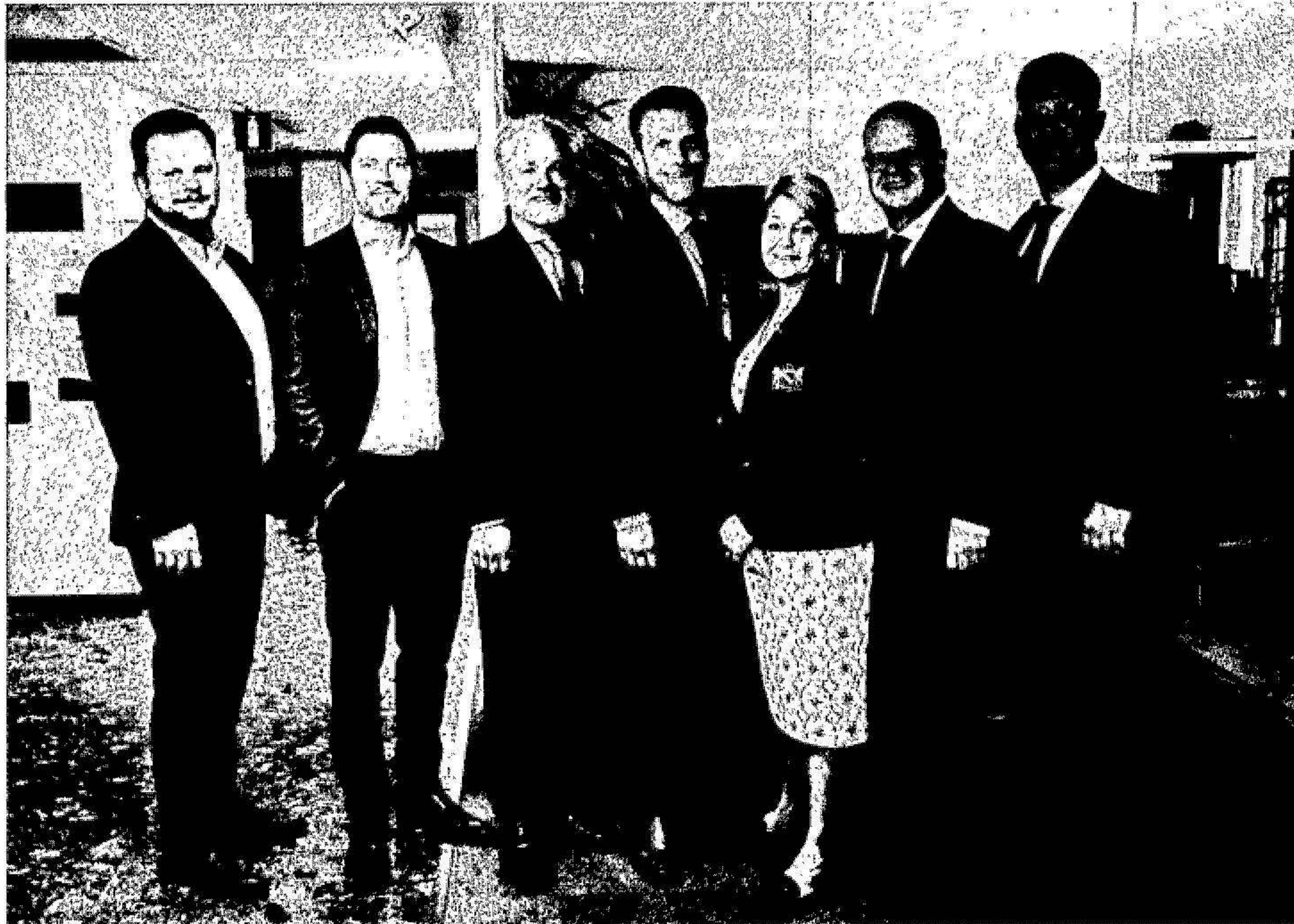
Styrelsen i Begoma Spedition AB