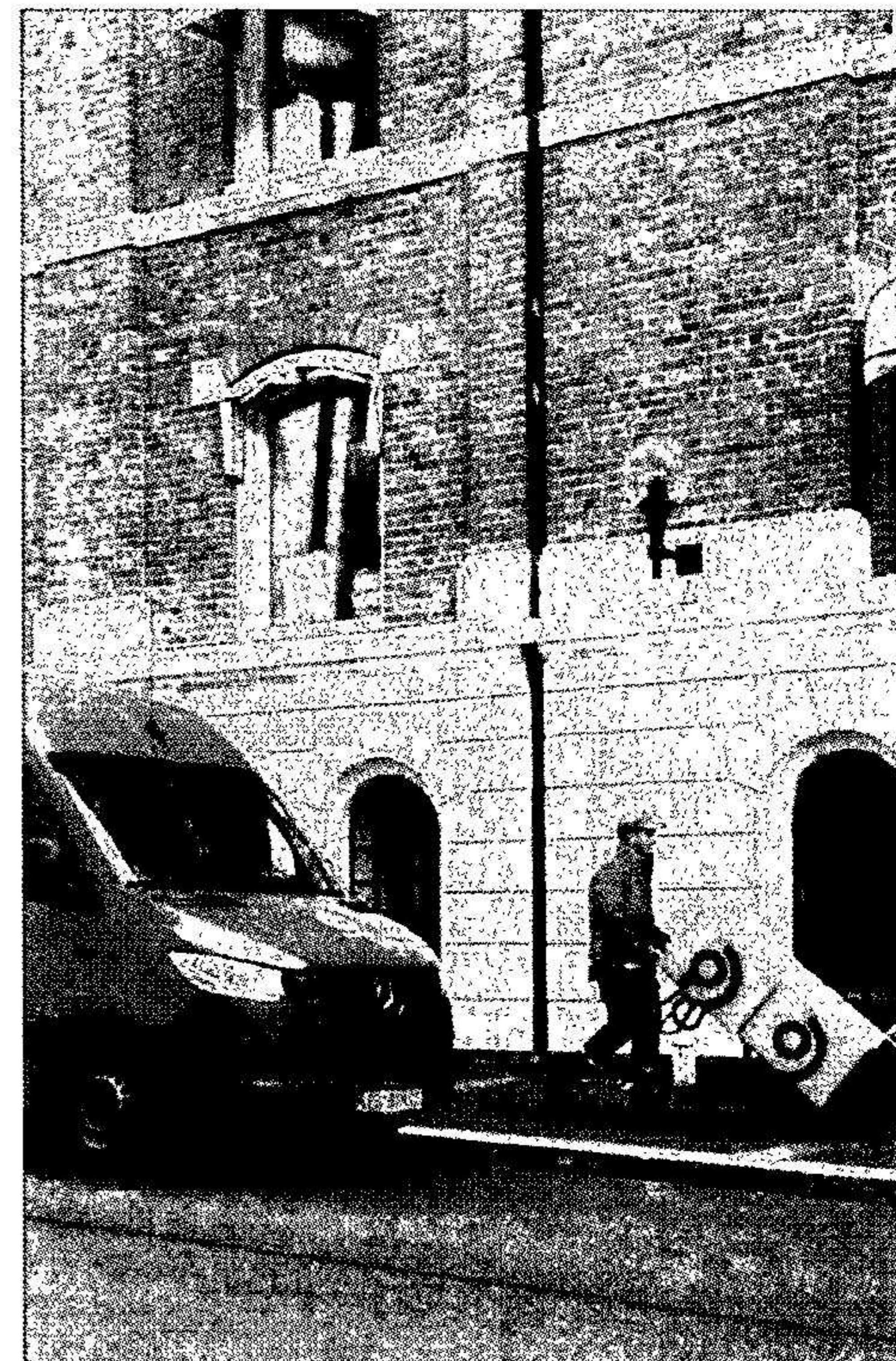
Konsernets globale hovedkontor i Oslo

Klimastrandete eiendeler Det ble foretatt en vurdering om konsernet har eiendeler som er eksponert for vesentlig klimarisiko (strandete eiendeler). Konsernet har ikke identifisert effekter som påvirket verdien av varige driftsmidler eller behov for å endre gjenværende levetid eller avskrivningsprofil (se note 10) i 2022 (tilsvarende i 2021).