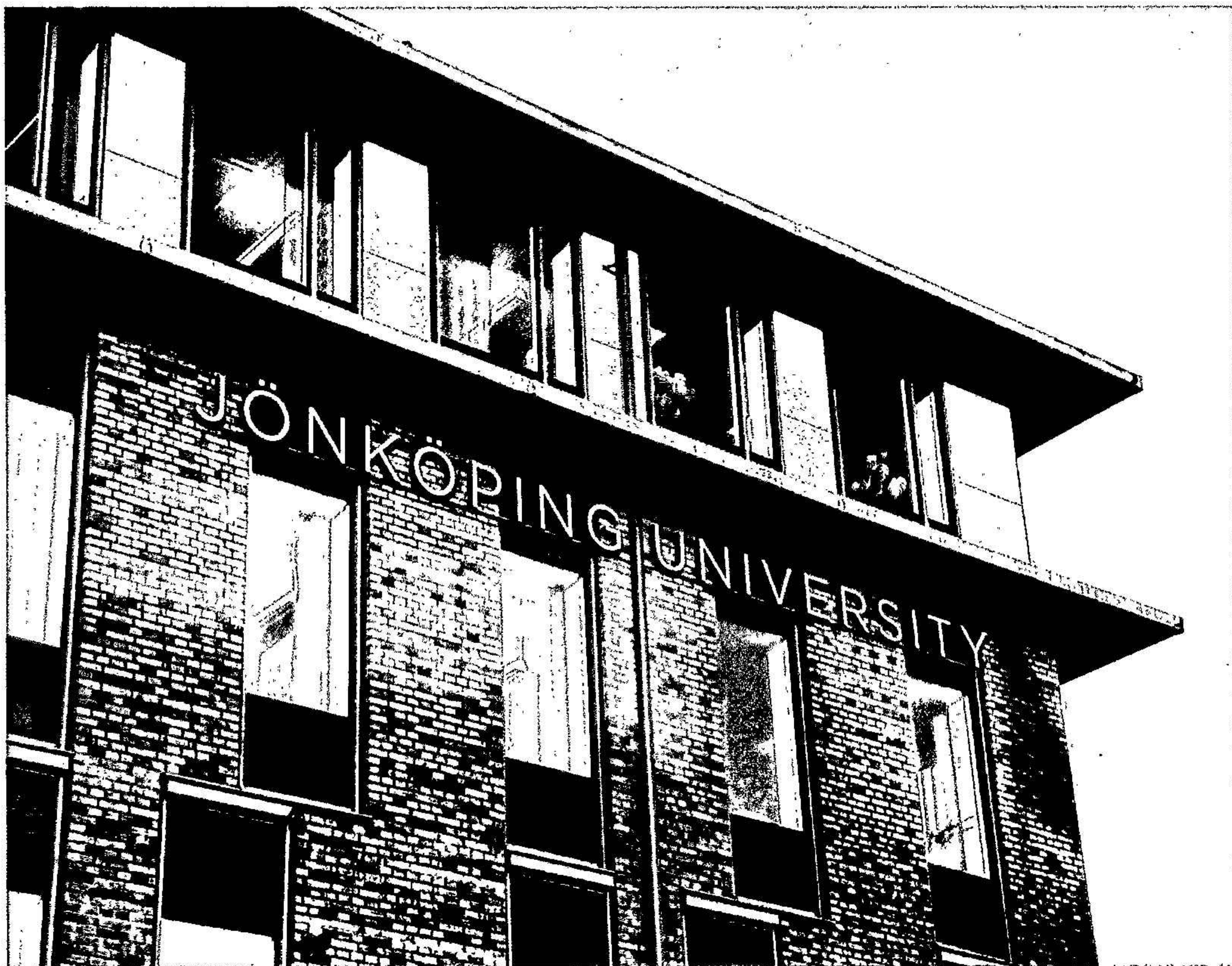
Hus K exteriör

Beträffande företagets resultat och ställning i övrigt hänvisas till efterföljande resultat- och balansräkningar, kassaflödesanalys samt noter. Alla belopp uttrycks i tusentals svenska kronor där ej annat anges.