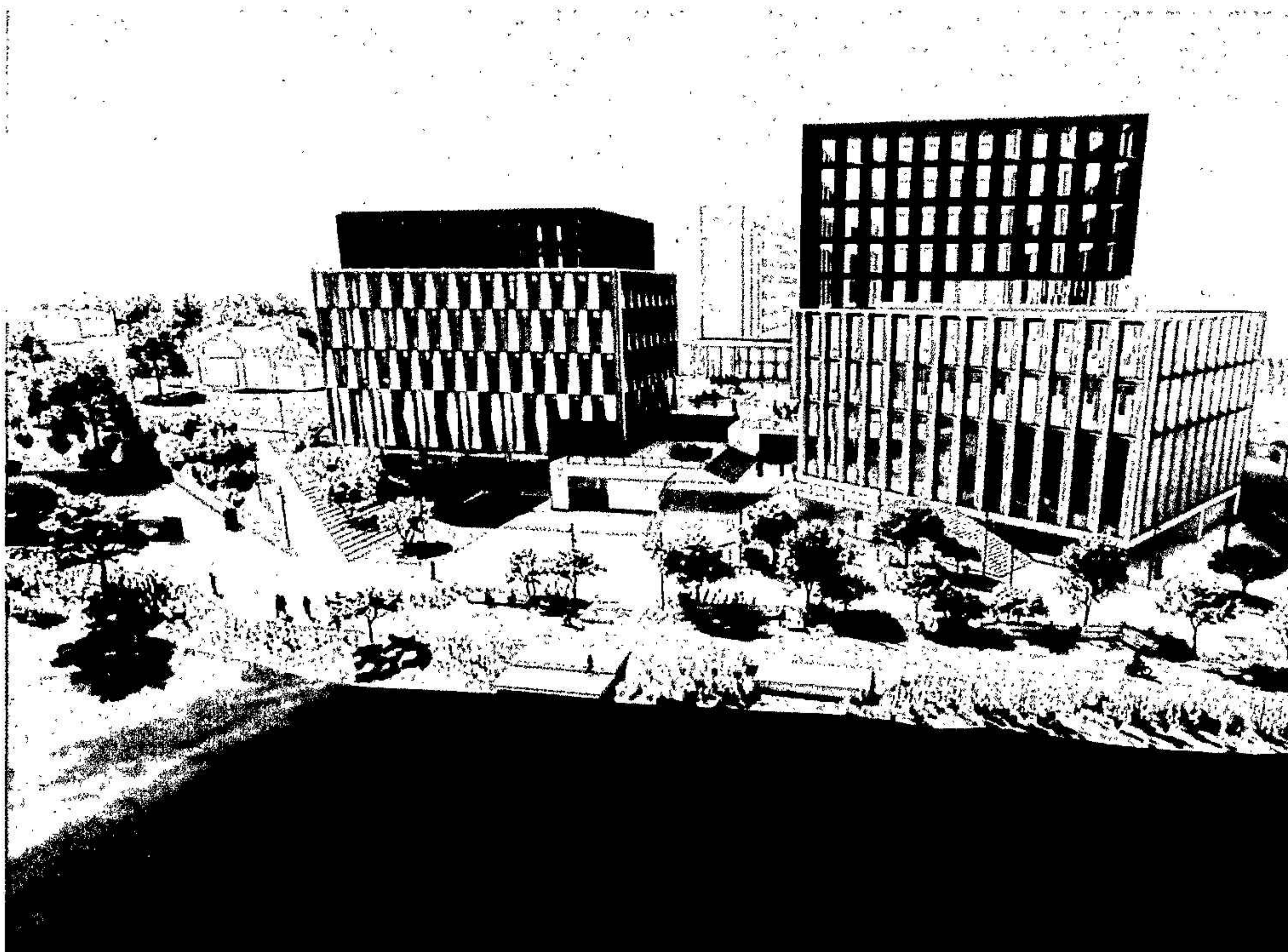
Visionsbild fastighet Lappen 16

Ett fortsatt omfattande arbete under året har varit arbetet med detaljplanen för Lappen 16. Detaljplanearbetet har blivit mer omfattande då detaljplanerat område har utökats. I detaljplanarbetet ansöks om en total byggrätt BTA yta på 43 000 m 2 . Parallellt uppdrag gällande arkitekter har genomförts och tilldelning skedde under året. Inför lagakraftvunnen detaljplan skall ett Exploateringsavtal med Mark och Exploatering tas fram då bolaget kommer behöva förvärva mark och sälja av mark. I tidplanen räknar man med att ha en lagakraftvunnen detaljplan 2026.