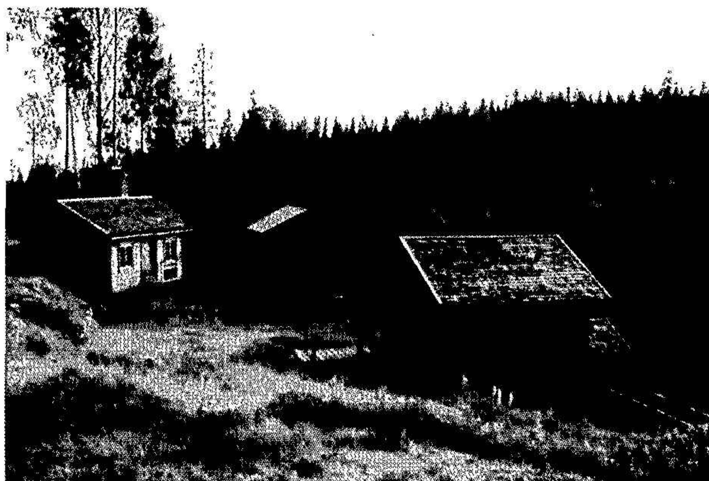
Till höger: Bollnäs Fluren 1:7, 1800-tals miljön.

Bolagets huvudsakliga verksamhetsområde är att arrangera studiebesök och temaresor samt att bedriva museiverksamhet genom att äga historiska byggnader med kulturhistoriska inventarier i byn Fluren i Hälsingland. Bolagets verksamhetsområde omfattar även att sälja tjänster och bedriva handel med skogsprodukter och innehav av värdepapper.