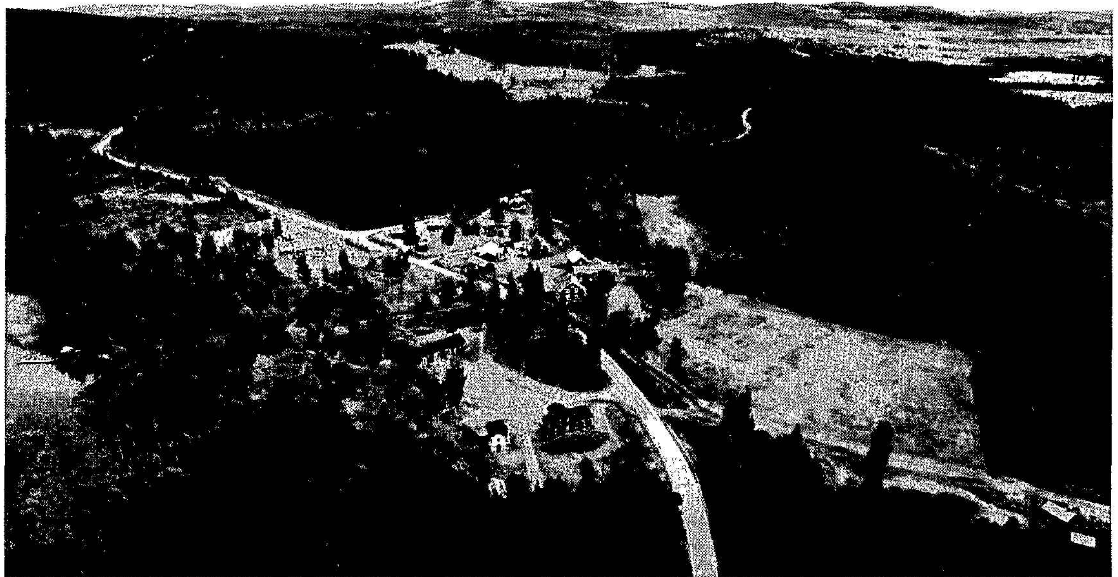
Byn Fluren med bolagets två fastigheter på var sida vägen i förgrunden. Till vänster om vägen Bollnäs Fluren 1:6 med ca åtta byggnader i 1900-talsmiljö och till höger Bollnäs Fluren 1:7 med ca 4 byggnader i 1800-talsmiljö.

Inga investeringar har gjorts under året. Investeringarna i byggnader och mark uppgår ackumulerat till 4 891 tkr.