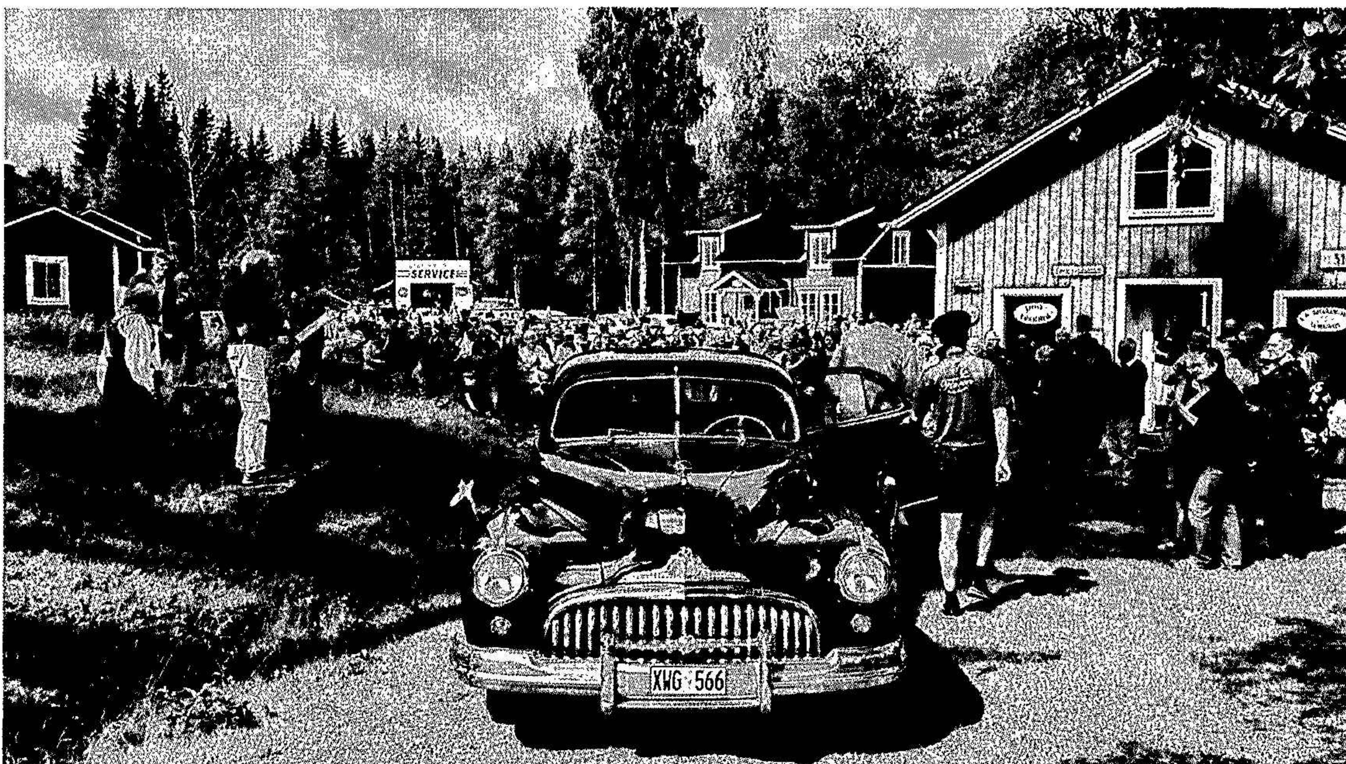
Bollnäs Fluren 1:6, 1900-tals miljön. Bild från evenemanget Skogens Dag med Kulturprisutdelning.

Bolaget äger två fastigheter, Bollnäs Fluren 1:6 och Bollnäs Fluren 1:7, vilka är belägna i byn Fluren i Bollnäs Kommun i Hälsingland. På fastigheterna har sedan millennieskiftet uppförts tolv olika kulturbyggnader samt två uthus och en vedbod i 1800-tals och 1900-tals miljöer. Syftet är att miljöerna ska återspegla gamla tider. Byggnadernas totala golvyta är 631 kvm och de står på en tomtareal på sammantaget 28 190 kvm.