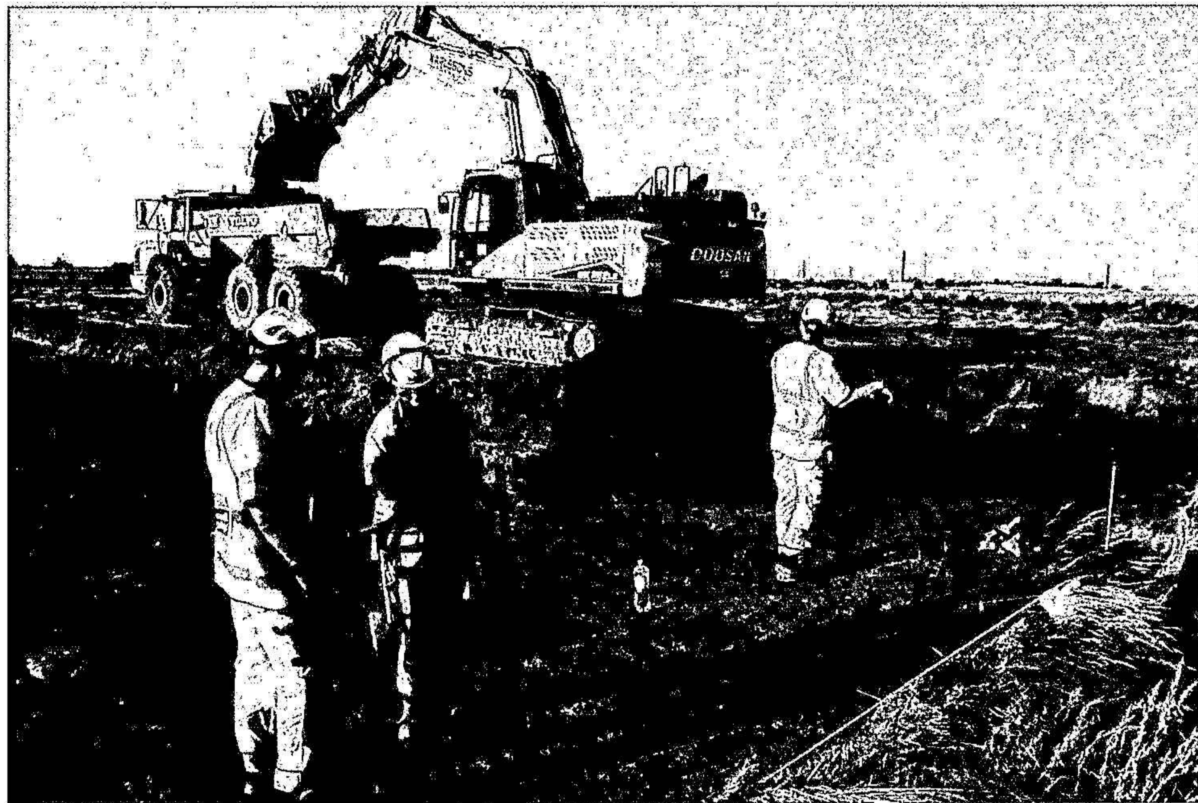
Fig 2: Våra arkeologer i aktion på grävningen i Dalköpinge: