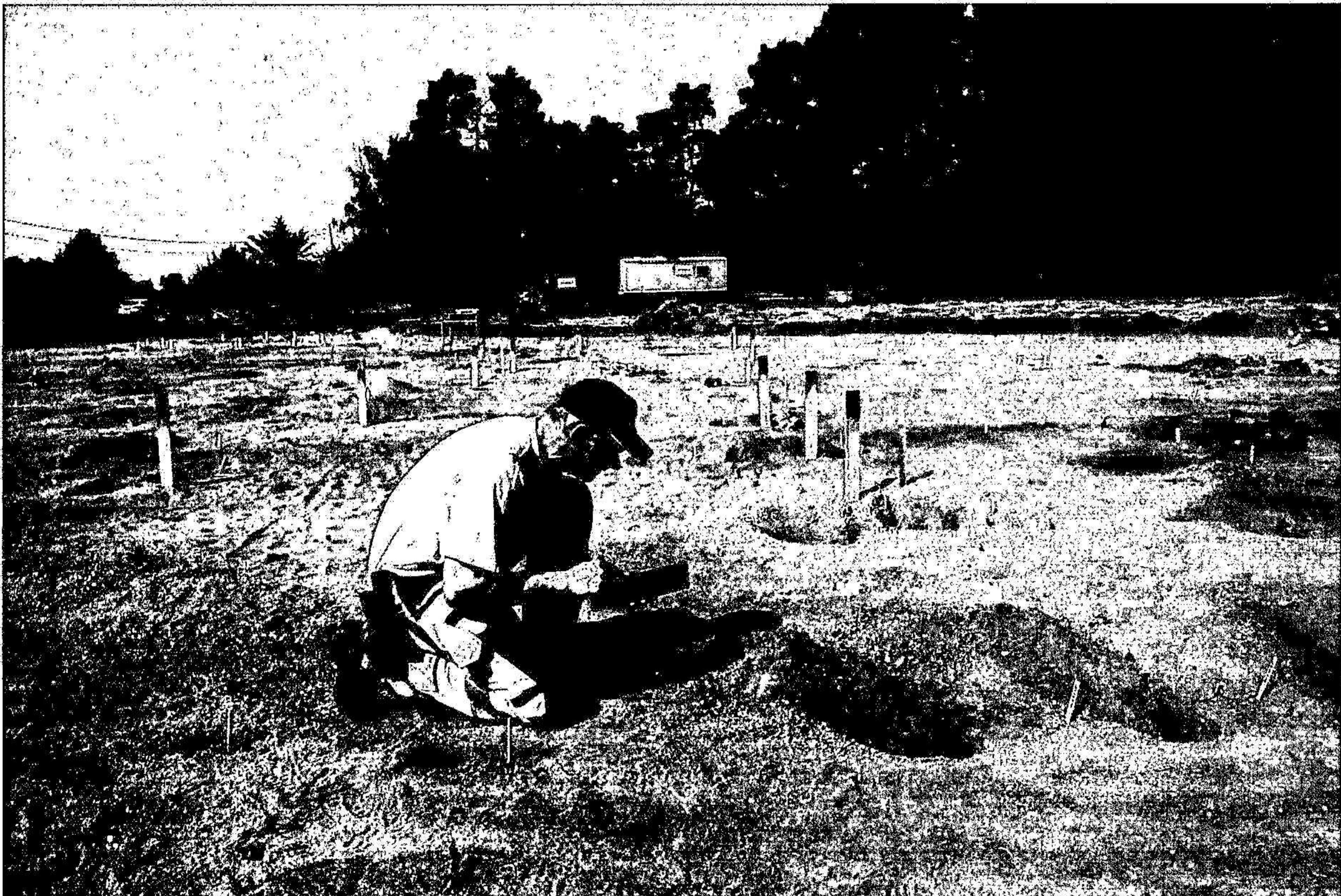
Fig 4: Tony Björk dokumenterar vid grävningen i Vä

Under några veckor i juni genomfördes en undersökning av en boplats i Vä. Vid utgrävningen påträffades totalt sju långhus varav de flesta var från bronsålder. Förutom detta undersöktes även en domarring samt gropar, härdar och en riklig mängd stolphål. Förutom detta påträffades en lågtemperaturugn, sannolikt för matlagning och ett antal gropar innehållande brända ben och keramik.