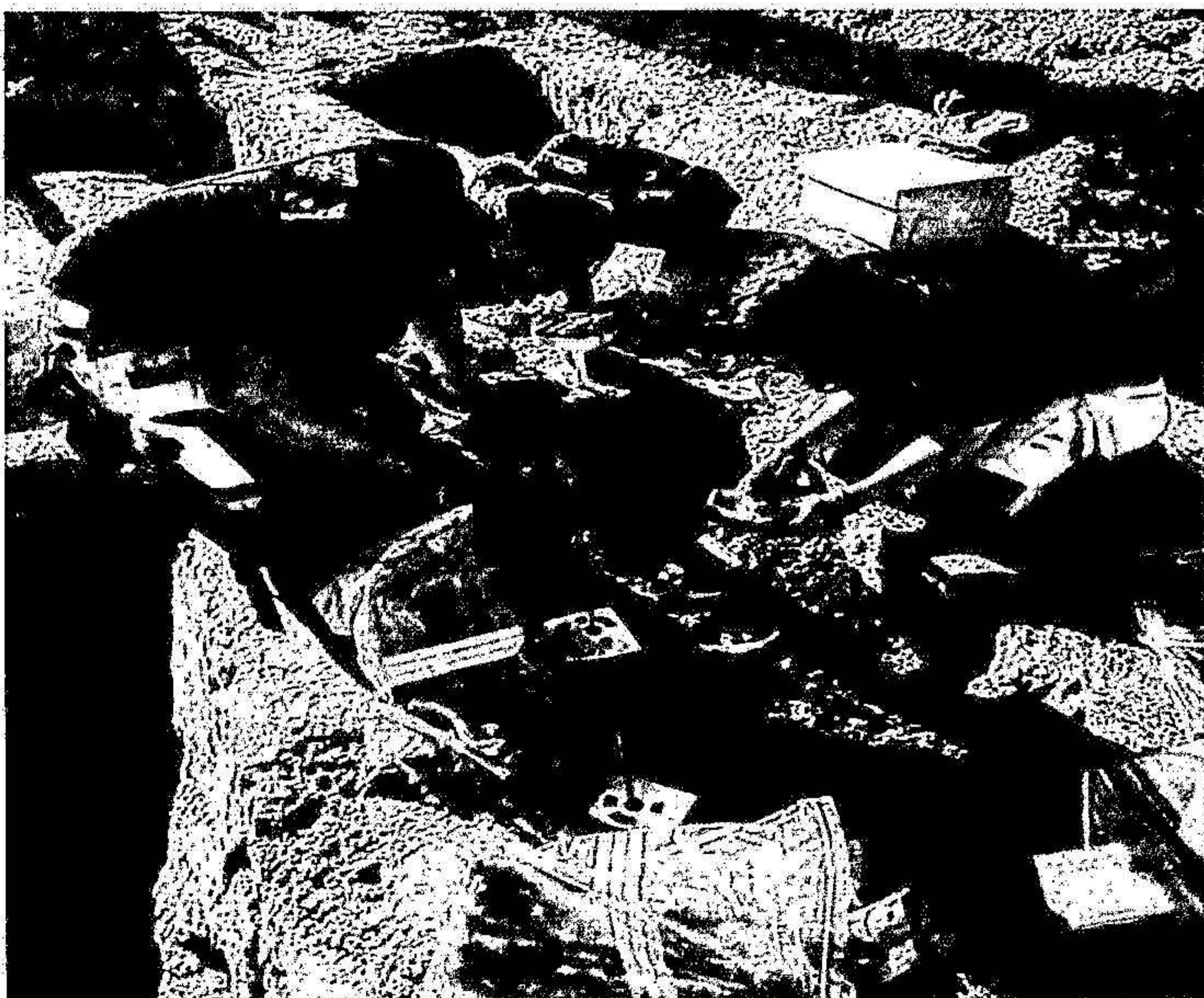
Fig 3: Undersökning av gravar vid det gamla fängelset i Kristianstad

Under året utfördes även en spännande undersökning på den gamla fängelsetomten i centrala Kristianstad. Här påträffades välbevarade mänskliga skelett som tillhört några av fängelsets tidigaste fångar. Fångarna i Kristianstad utgjordes huvudsakligen av ekonomiska brottslingar, det fanns även uppgifter om individer som avrättats. Orsaken till undersökningen var ett anonymt tips om att fångar skulle vara begravda på platsen. Efter en inledande kulturhistorisk bakgrundsanalys påträffades en lista på livstidsfångarna som ska ha begravts på fängelsetomten mellan år 1858–1861, en så kallad dödsbok. I denna finns angivet namn, ålder och dödsorsak. I dödsboken finns även uppgifter om avrättade individer. Totalt påträffades tio individer vid undersökningen.