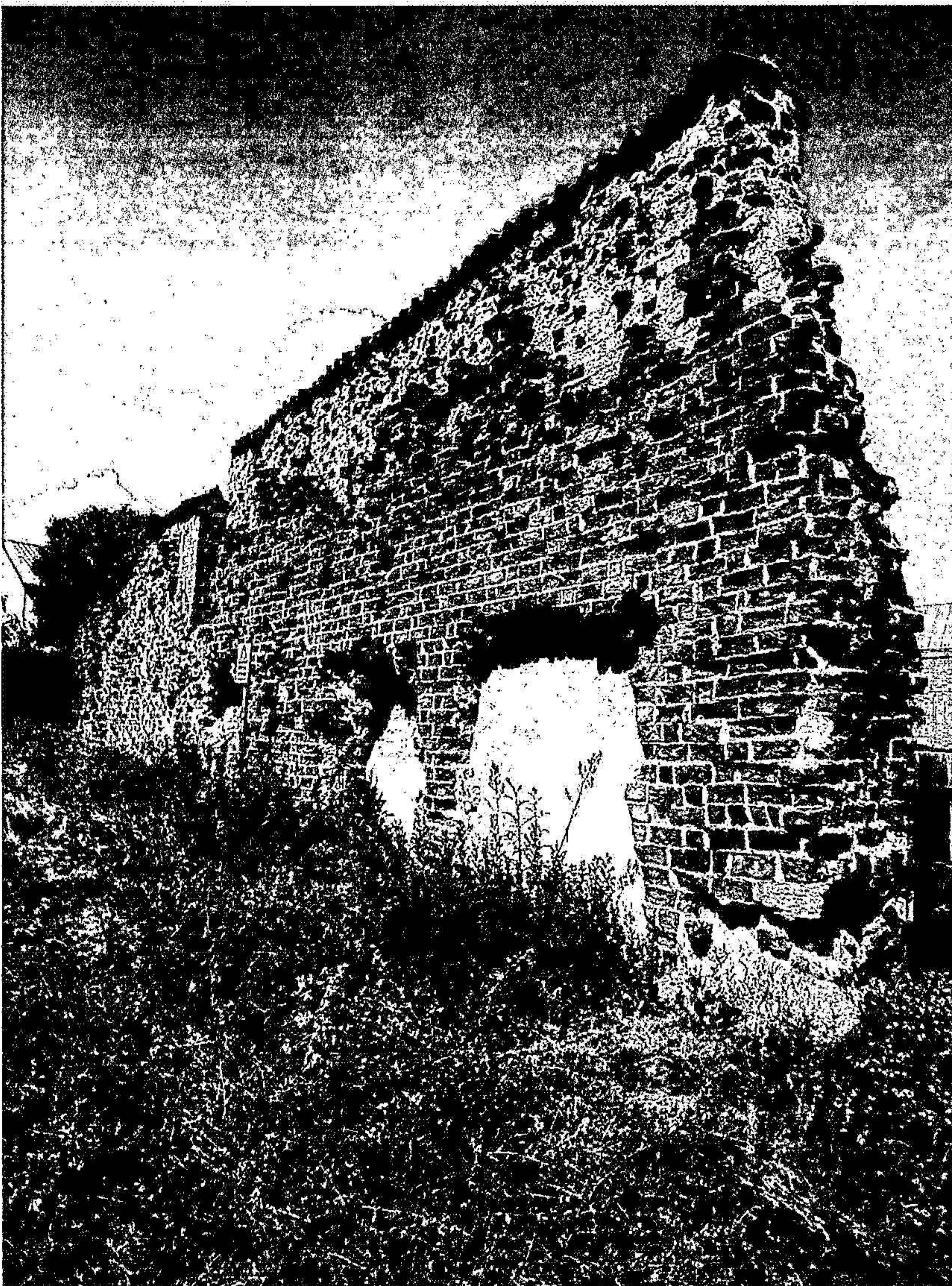
Fig 5: Konventmuren i Åhus

Sammanfattningsvis gav begränsade antikvariska insatser i Konventparken, mycket goda resultat. Anläggningens planform inom konventets centrala delar framgick tydligt vid karteringen med markradar (GPR); resultat som senare kunnat bekräftas i upptagna sökschakt. Förekomst av medeltida gravar har kunnat beläggas. Dessutom har kyrkans läge samt den östra längans bredd och möjliga rumsindelning kunnat konstateras.