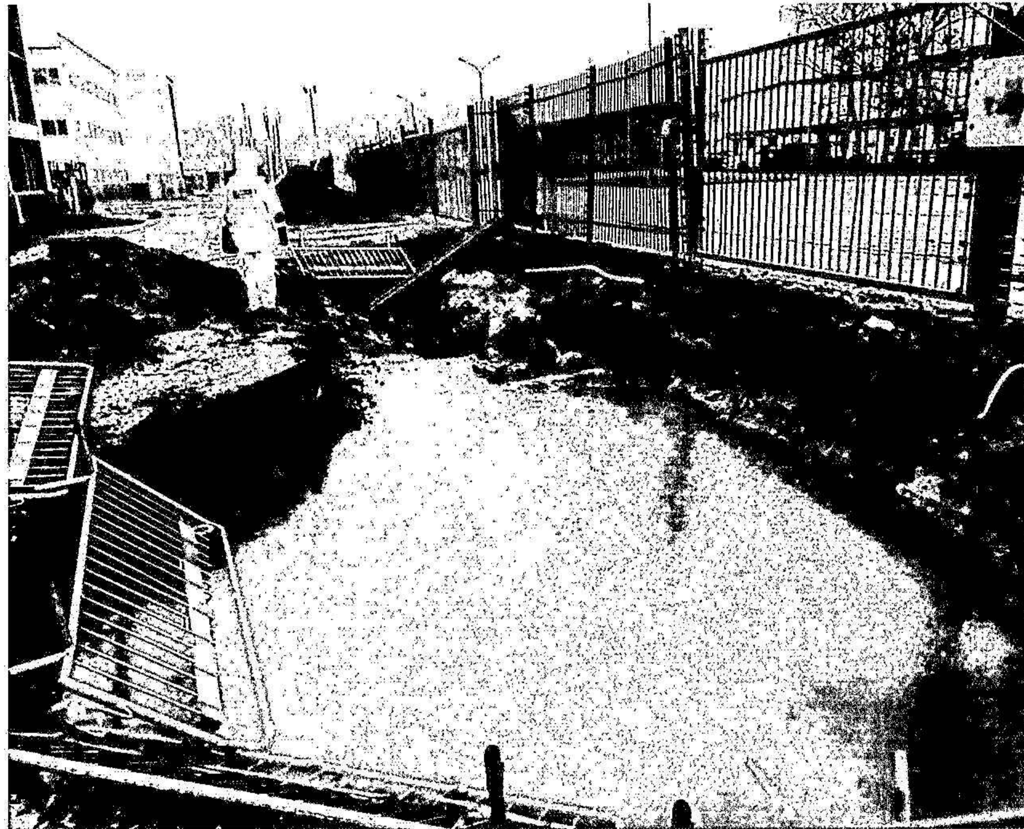
Fig 1 Första dagen i fält vid undersökningen på fastigheten Huggjärnet i Helsingborg