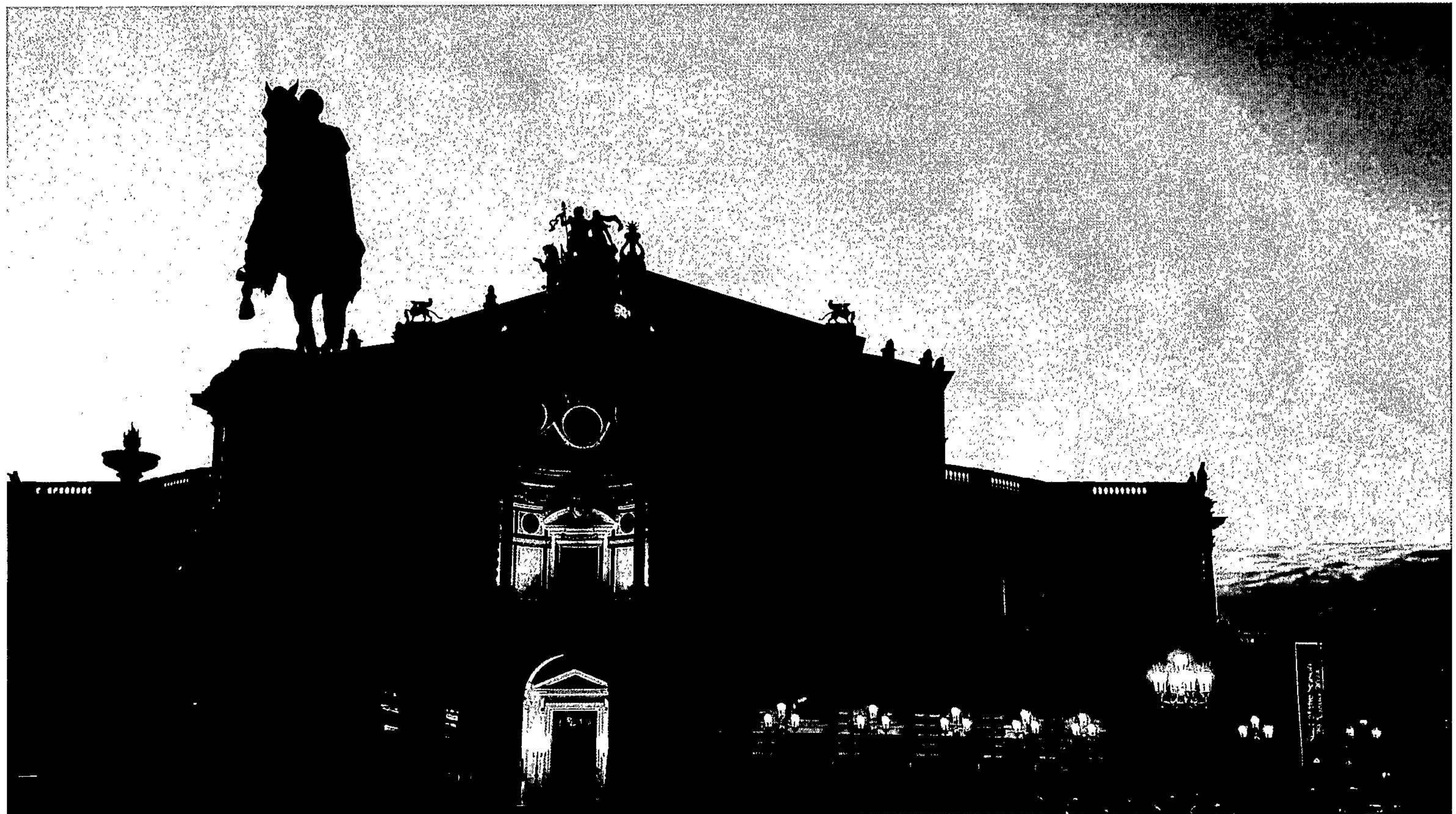
Operahuset i Dresden