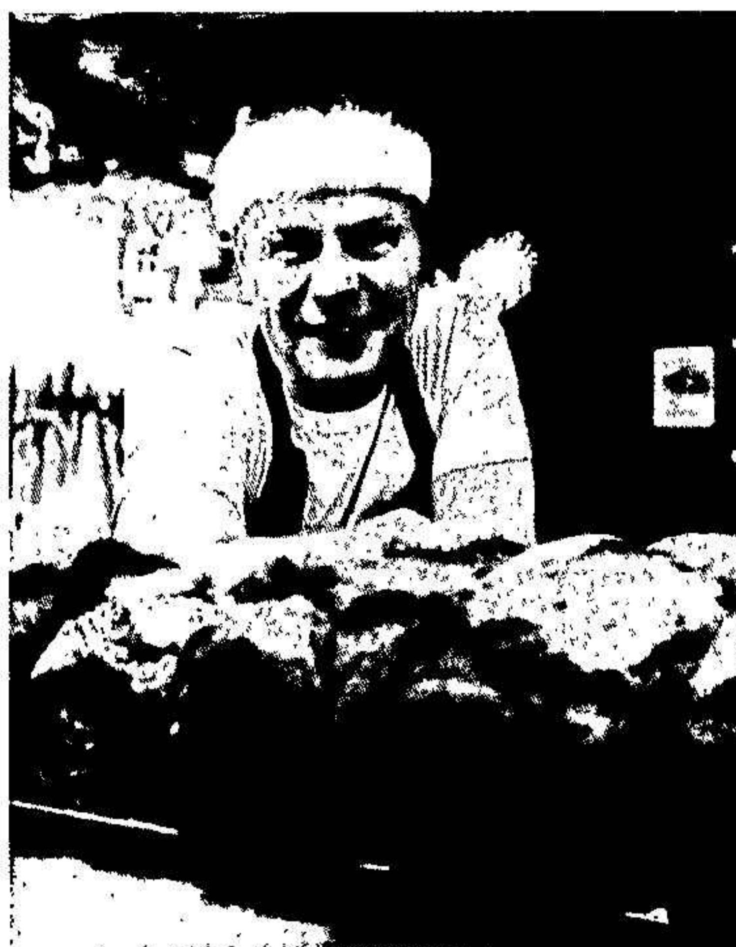
Provbak av vörtbröd i den nya bagerilokalen inför återstarten 2025