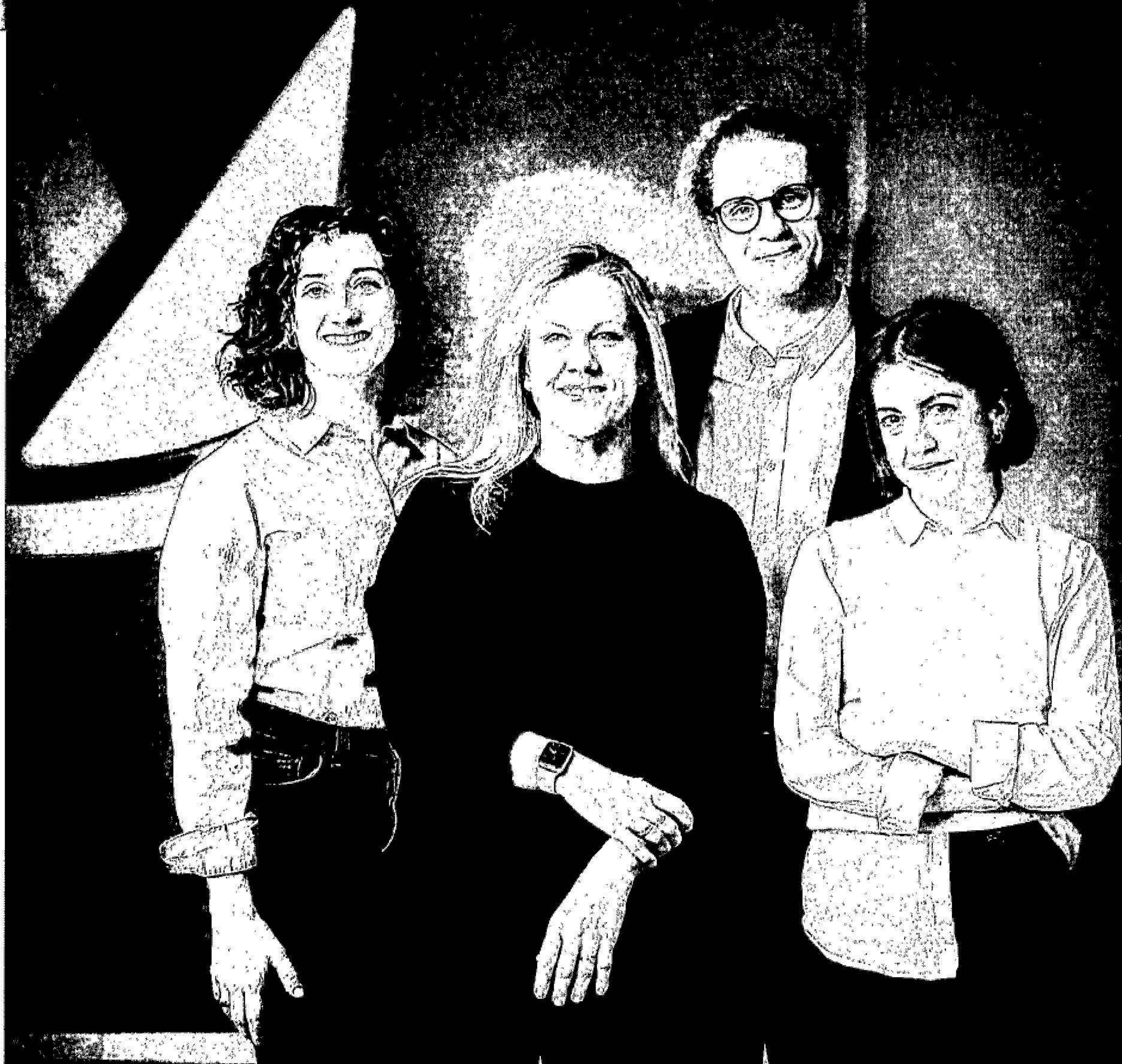
EMEA Academy Teamet