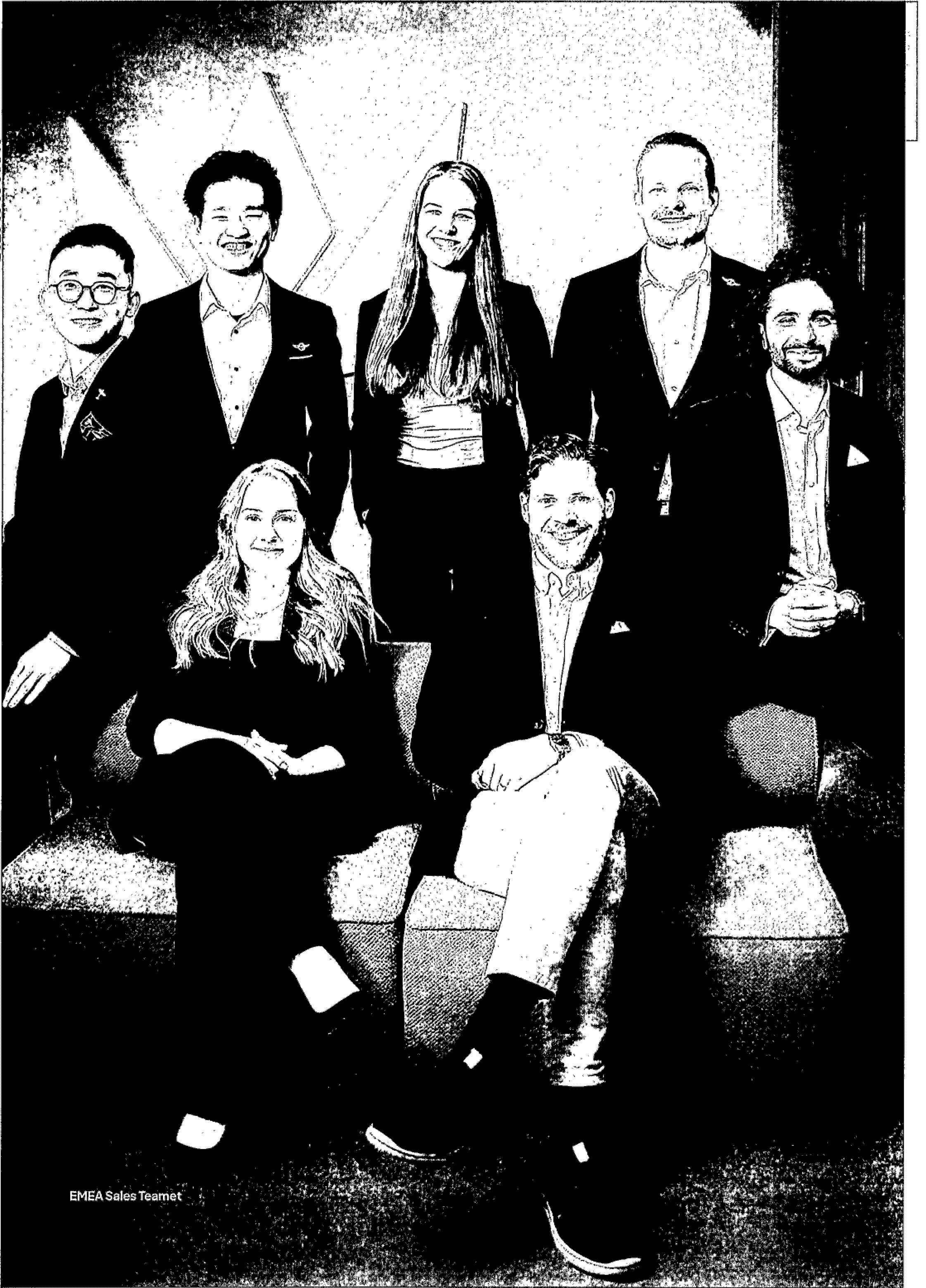
EMEA Sales Teamet