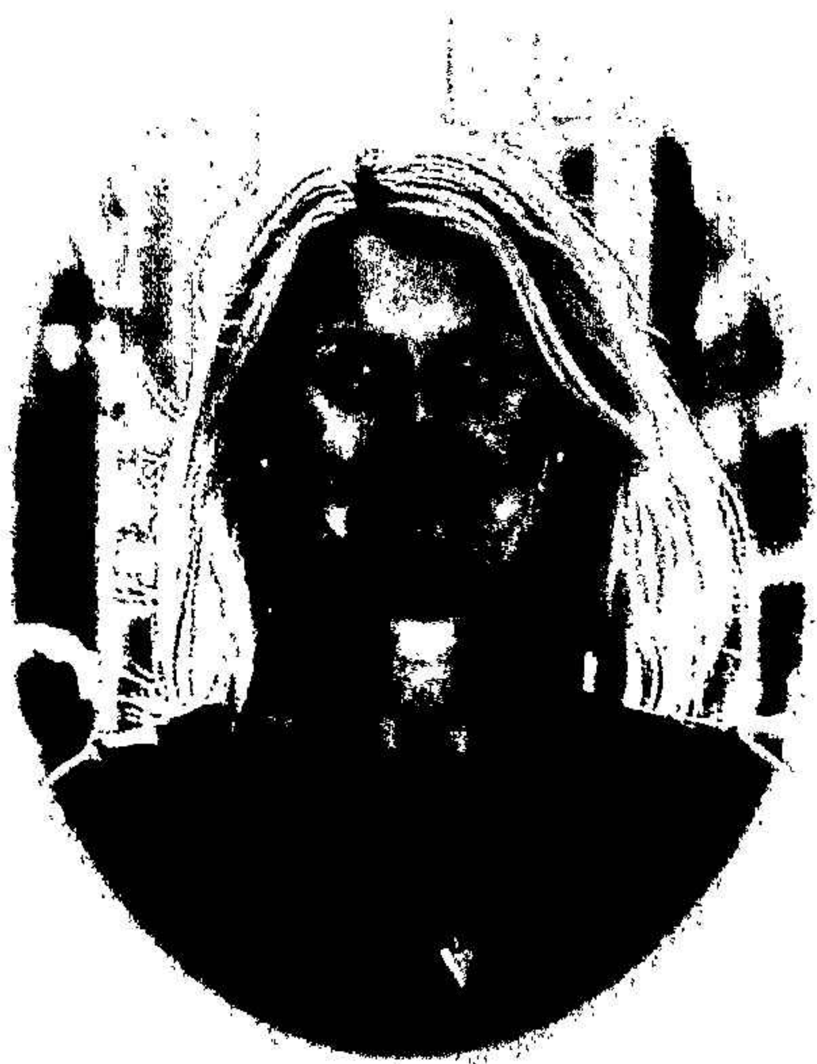
VD Invent Medic Sweden AB (publ) Lund i april 2025

Framtiden ser ljus ut, med starka signaler från flera marknader, särskilt för Efemia kontinensstöd. Invent Medic drivs framåt av ett engagerat team som fokuserar på att både stärka positionen på hemmamarknaden och expandera internationellt. Tyskland framstår som en strategiskt viktig marknad där insatserna intensifieras och samtal förs för att identifiera rätt samarbetspartner. En djupgående marknadsundersökning av det tyska vårdssystemet har gett värdefulla insikter som banar väg för framgångsrika partnerskap och en optimal distributionsmodell, vilket stärker möjligheterna att etablera sig på denna nyckelmarknad.