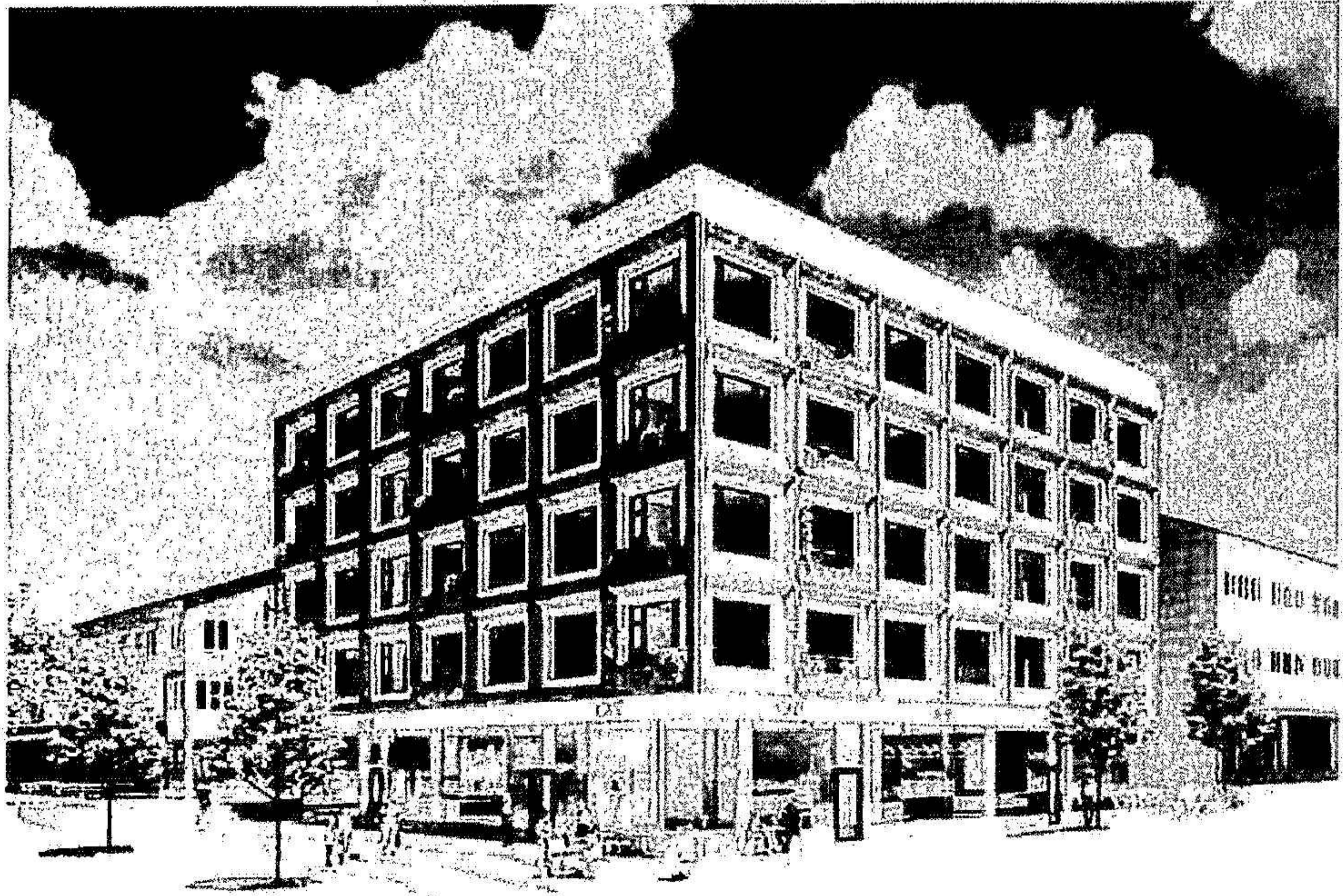
Bostadshus Vallentuna Torg