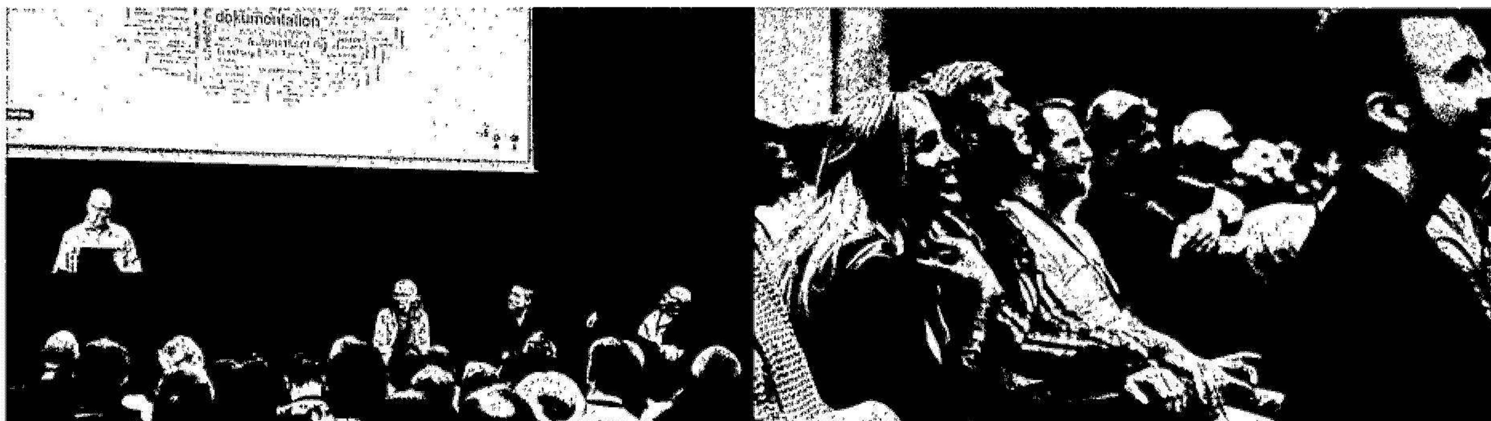
1 Bilder från Vårmötet 2024 i Stockholm

Digpro är aktivt på ett flertal mässor i ett antal olika länder, bland annat SSNF, FTTH Council, Connected Britain och INCA. Ett av årets största egna events är Digpros årliga Vårmöte (användargruppsmöte) med runt 300 deltagare, där kunder samlas under en två dagar lång konferens. Under Vårmötet presenteras nyheter i Digpros lösningar. Det bjuds även in till nätverkande, diskussioner om hur Digpro kan utveckla lösningarna för att bäst passa kundernas behov och kunder delar med sig av sina erfarenheter av att effektivisera och utveckla sina verksamheter med stöd av Digpros lösningar.