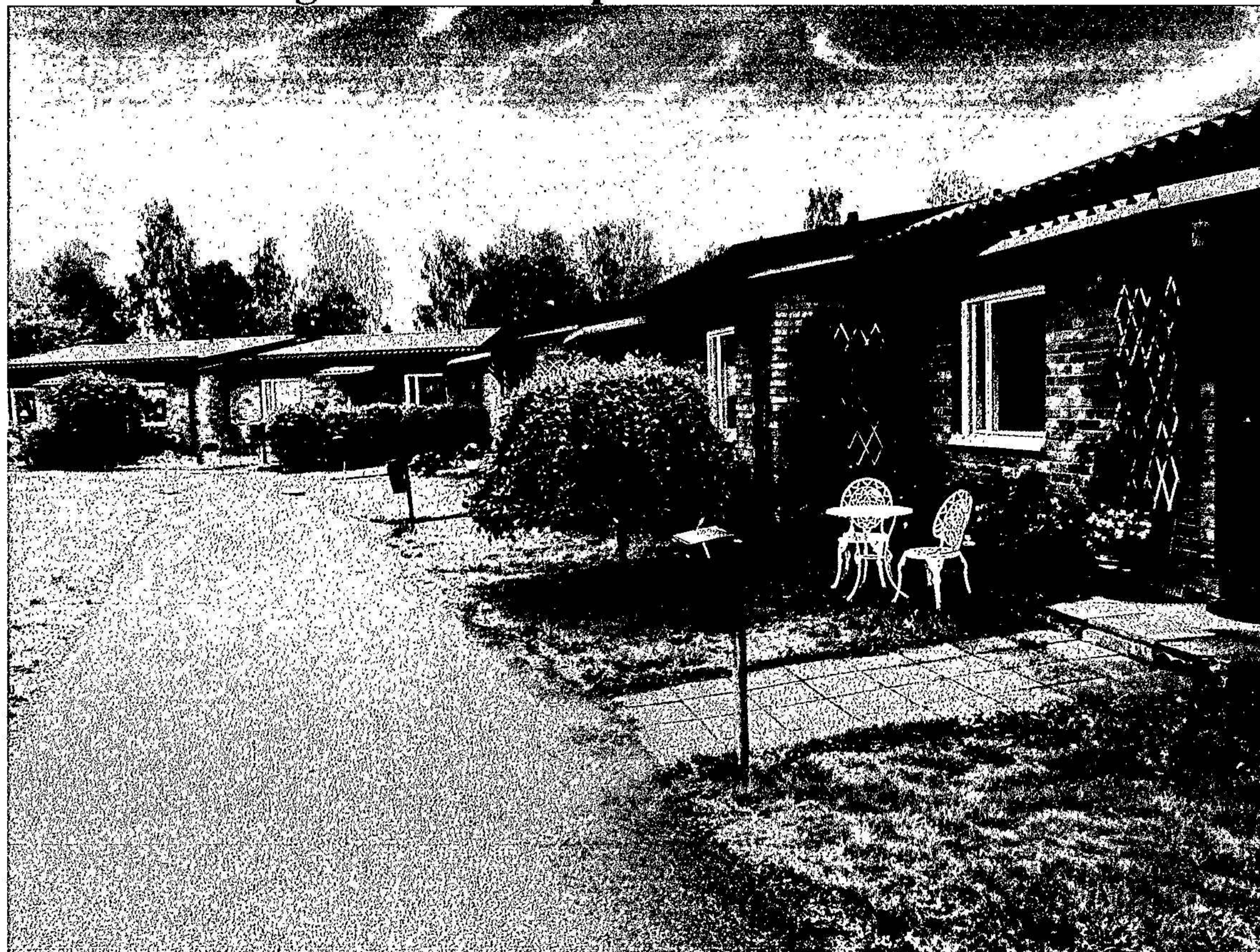
Bild1. Enplans radhusen på 84 kvm med två egna uteplatser

Styrelsen avger följande årsredovisning.